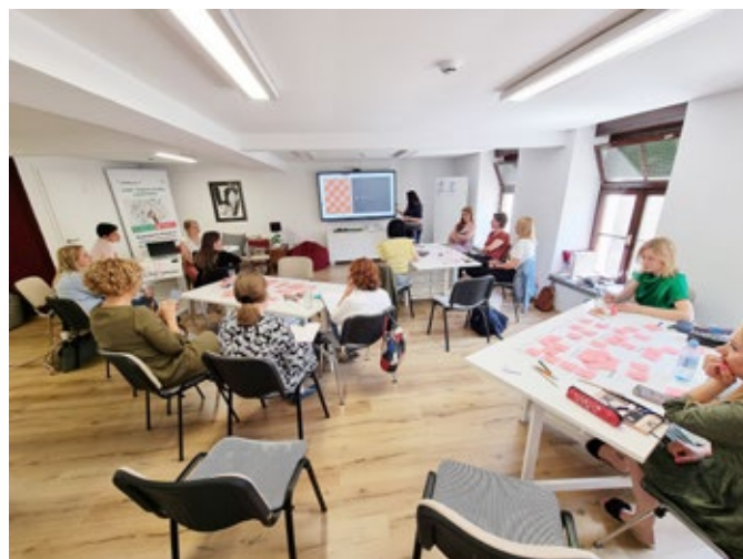
Učitelji v »Akademiji PoMP« na Ptuj

Rezultat projekta, s katerim sledimo zastavljenim ciljem, je med drugim tudi obsežna spletna učilnica, ki se imenuje Akademija PoMP in je prosto dostopna ter brezplačna za uporabo na spletni