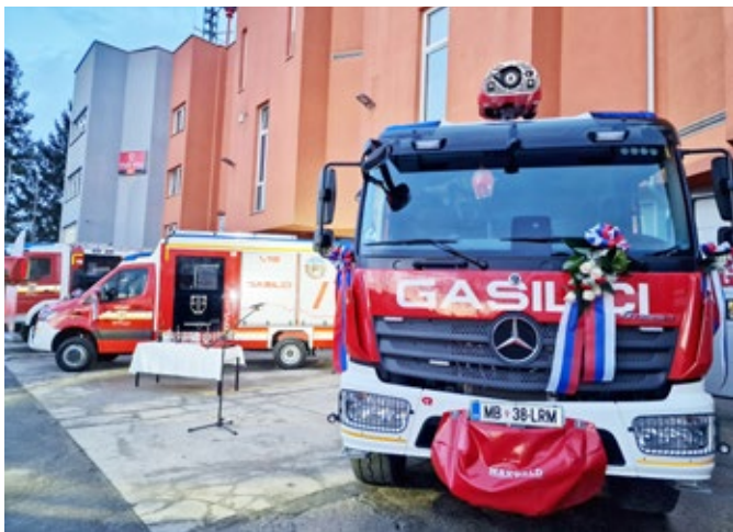
Manjše gasilsko vozilo za logistiko in večje gasilsko vozilo s cisterno so ptujski gasilci tudi uradno predali v uporabo.