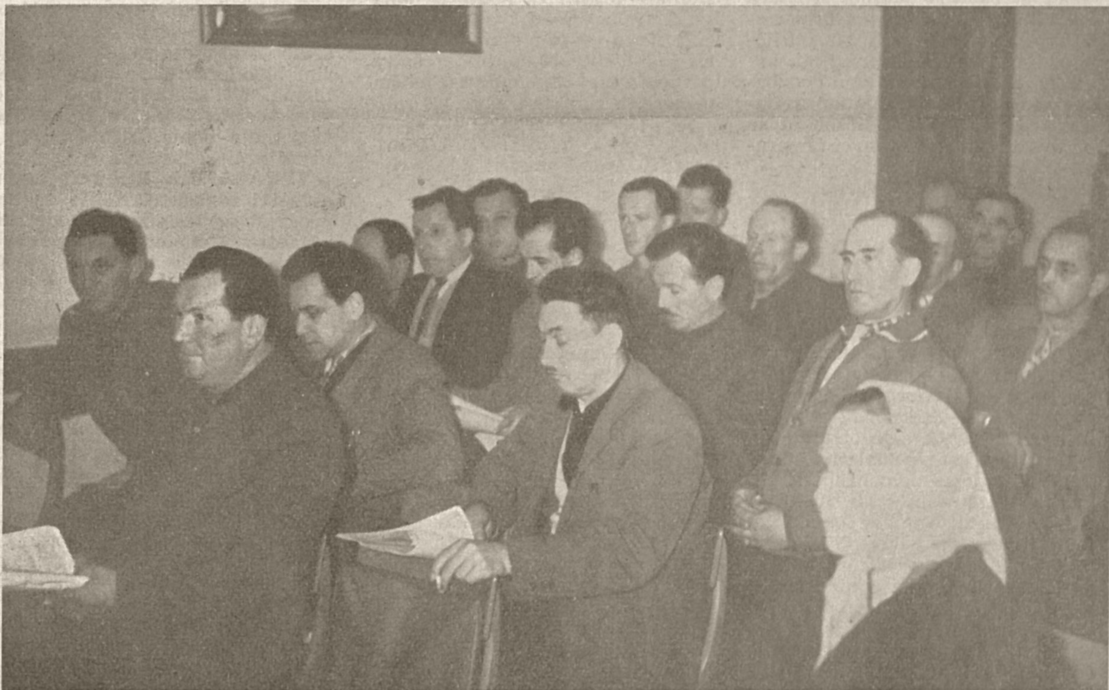
Članji obeh zborov na zadnji seji v Cerknici

Seja je bila zelo živahna in odborniki so dobro posegali v razpravo. Kot zelo pozitivno pa je bilo to, da so dobili odborniki ves material za sejo že nekaj dni pred sejo.