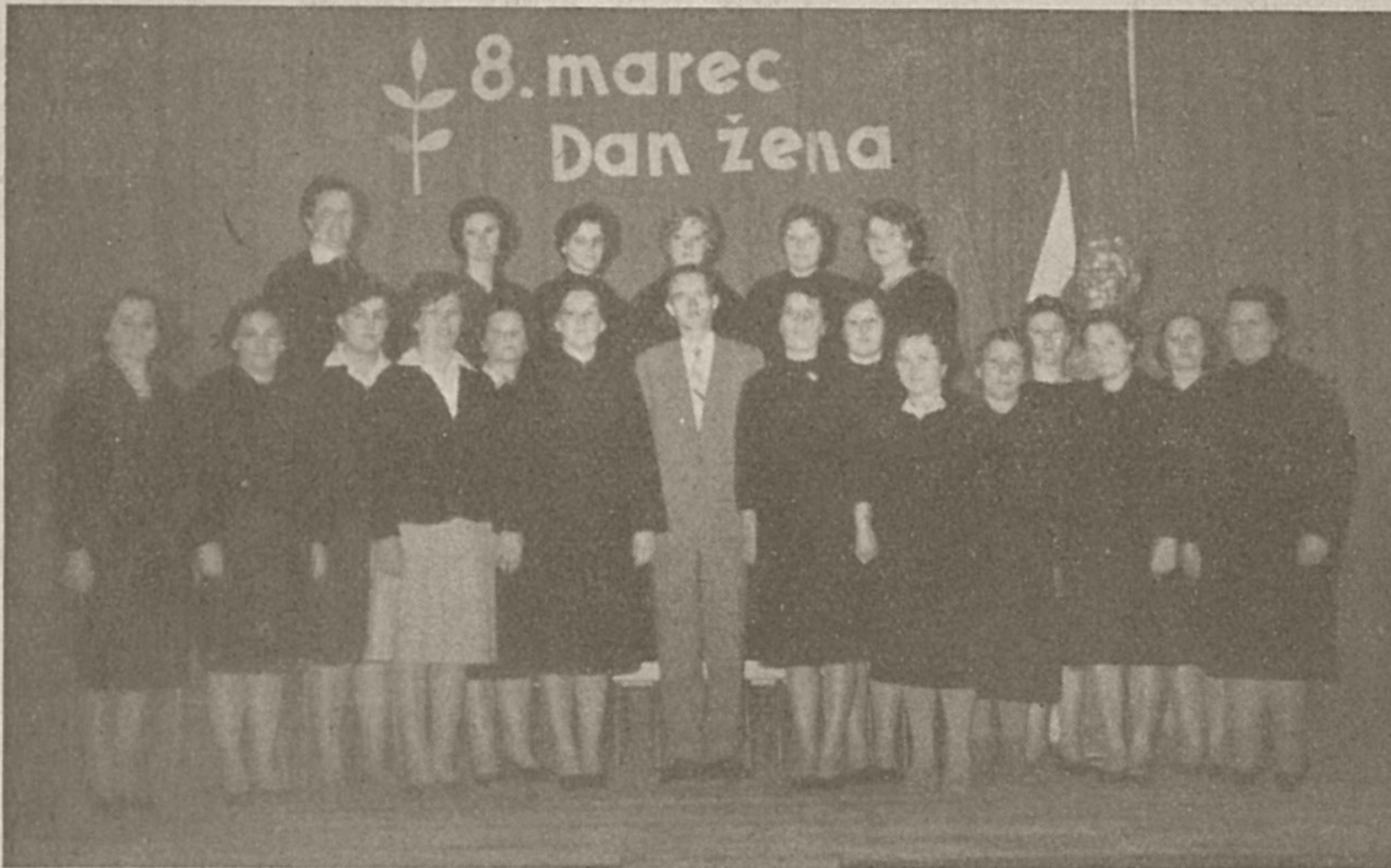
Ženski pevski zbor v Cerknici

pol urice le nekaj članov zborra, vaja ne uspe . . . Prejšnji zbori so razpadli predvsem zato, ker so bili člani premalo požrtvovalni. Mnogokrat pa so naleteli tudi na nerazumevanje odgovornih ljudi v cerkniški občini. Na sestankih so veliko govorili o tem, da je treba podpirati prosvetno dejavnost na raznih področjih, ji dajati nove smernice in skrbeti, da bo zaživele. Prav tako govorili tudi o pevskega zborih; pevci so sodelovali na vseh proslavah, praznovanjih itd. To je postala njihova dolžnost, čeprav so bili obveščeni o času in kraju nastopa čestokrat samo kratke tri dni prej. Kako pa po nastopu? Včasih se je res kdo spomnil in se pevcem zahvalil za sodelovanje, saj je bila to