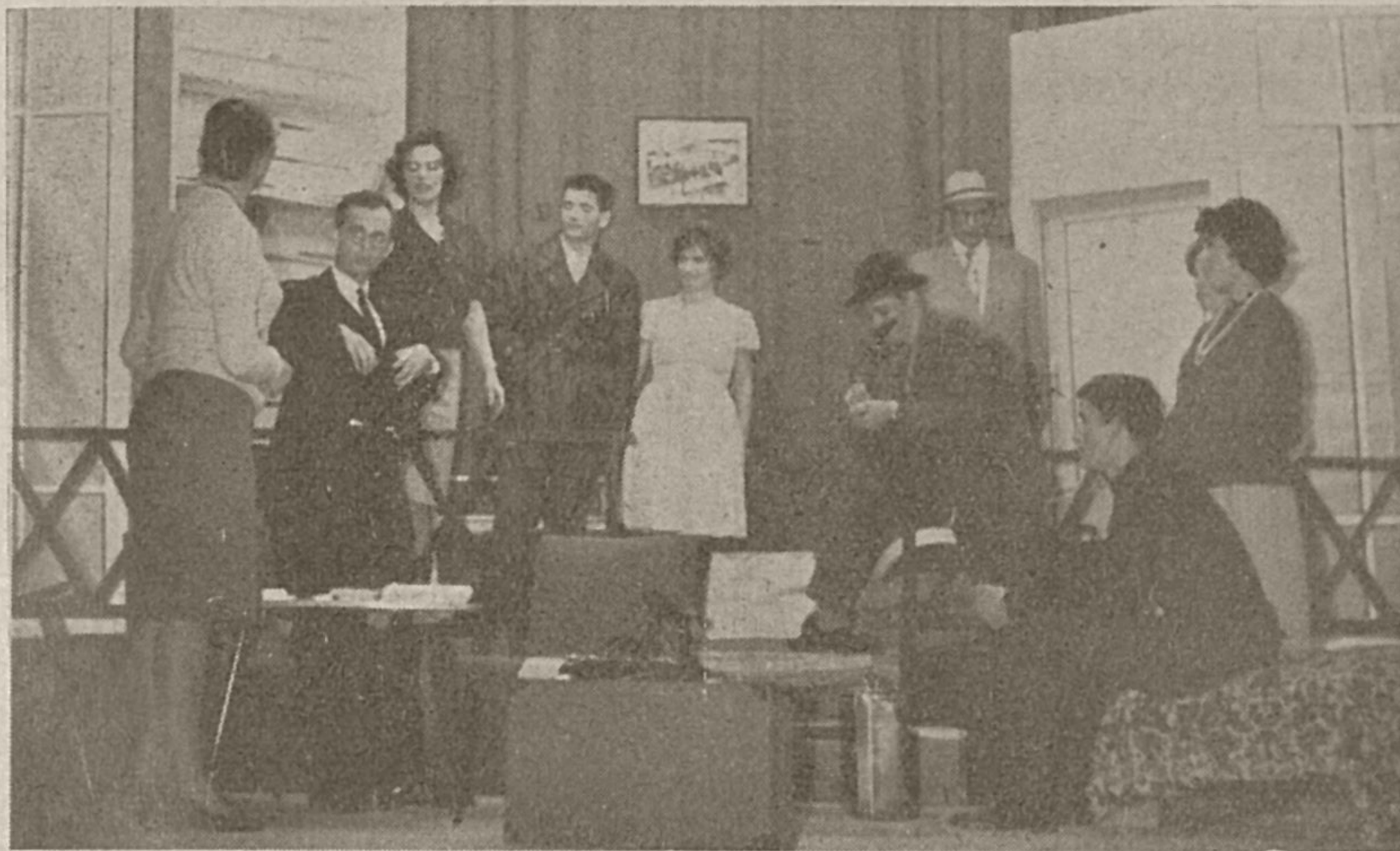
Dramska skupina mladih Rakovčanov se je z uspehom predstavila na reviji dramskih del v Cerknici

Pri izvajanju del so opazili, da večina igralcev ni pokazala dovolj dinamike, da ni tekel tekst. Pomankljiva je bila tudi izgovorjava, maskiranje, scena ter razsvetljava. Če upoštevamo pogoje, v kakršnih delajo ti amaterji, moramo vsem trem kolektivom izreči