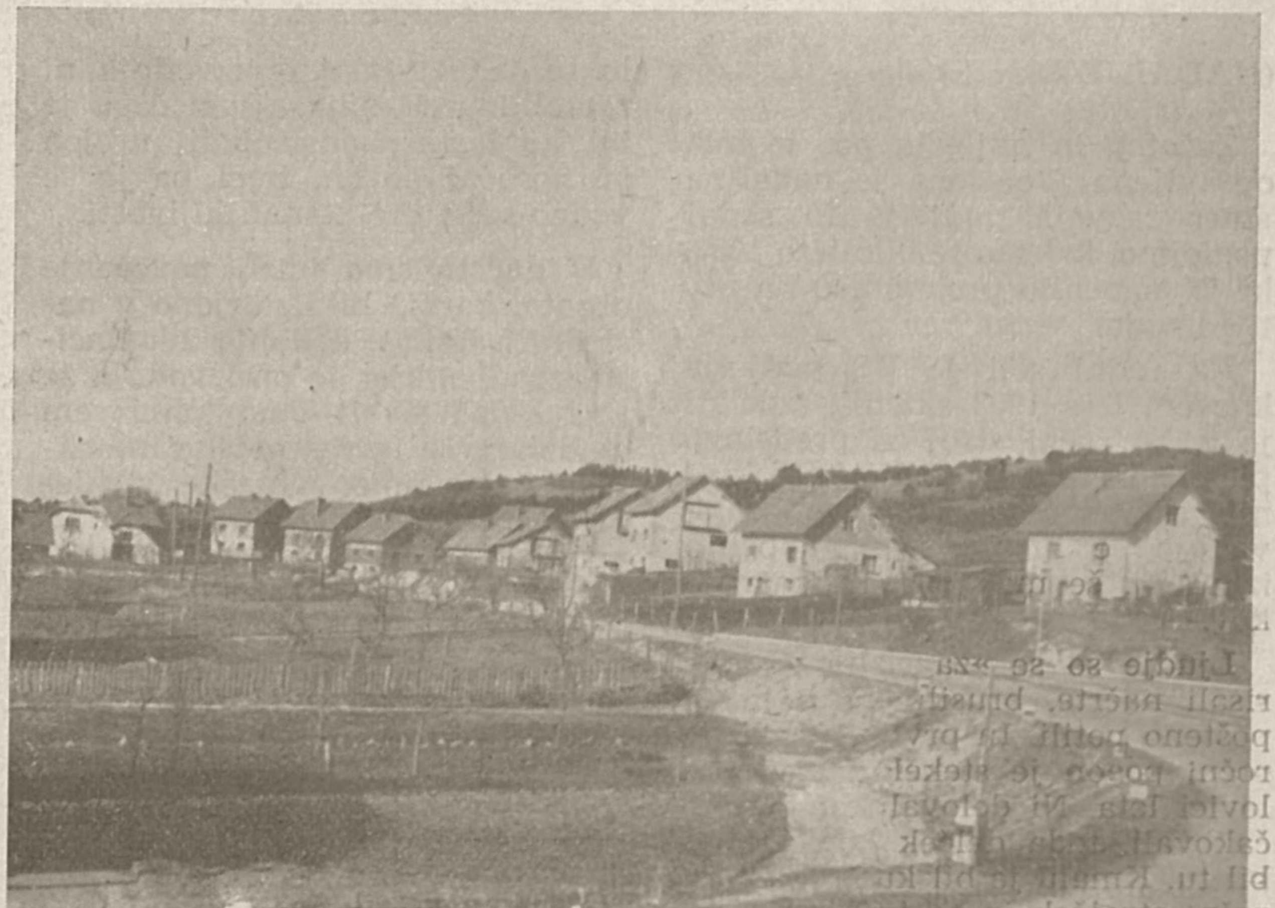
Zadnja leta se je gradnja manjših stanovanjskih hiš zelo razširila tudi na Rakeku