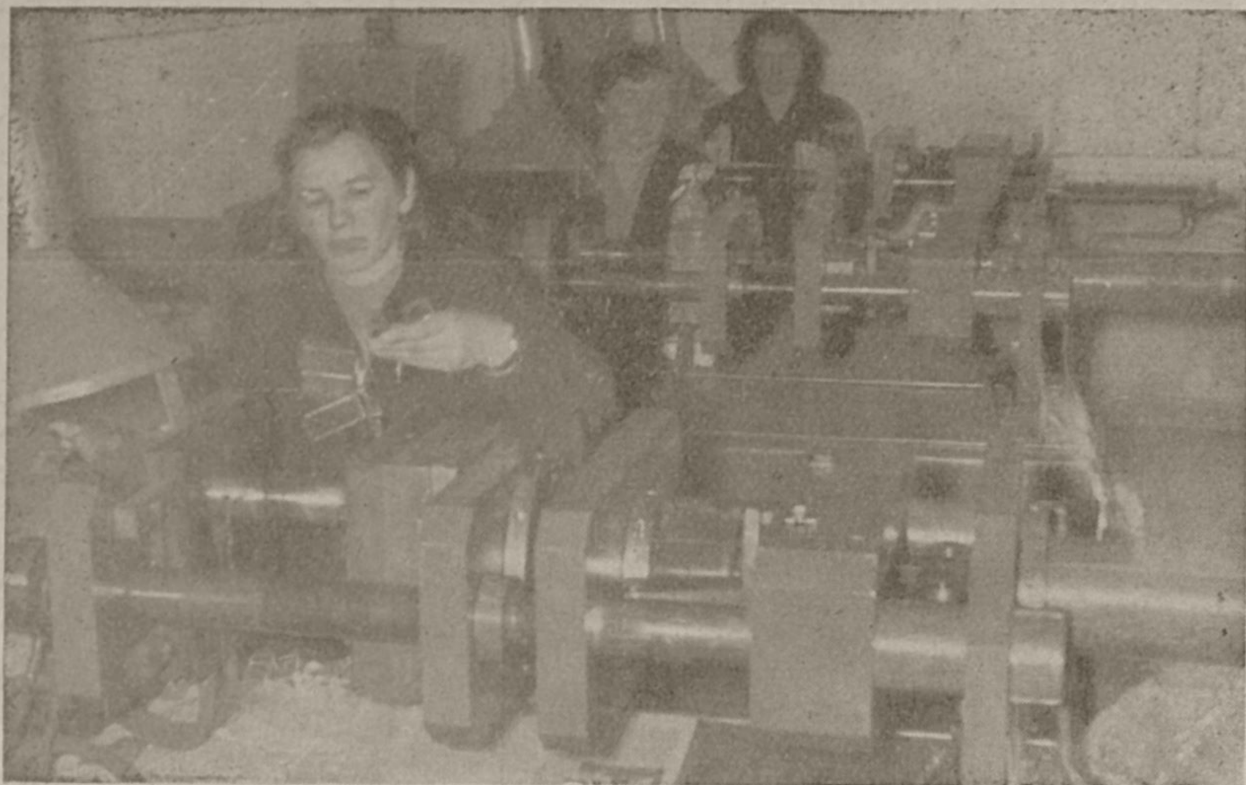
Pri izdelovanju plastičnih izdelkov