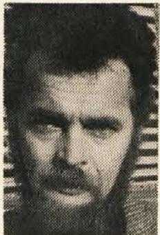
Tajnik Koroškega partizanskega pevskega zbora

dno znova osvojijo srca našega človeka, mu dajo duška za njegovo vztrajanje v borbi za narodni obstoj in solidarnosti z vsemi zasužnjenimi narodi, ki se borijo za svojo neodvisnost in svobodo. Koncert pa