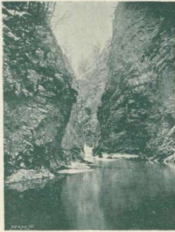
Najožji prehod v Vintgarju.

tankem stebelcu je lezla oprezno in počasi niže in niže. Prilezla je malone do tal. Aha! prav tu je ležala gladka, precej velika skalica in na drugi strani zopet bilka. Na skalico se mora spustiti na vsak način. Tedaj pa, ko bo prilezla prav na rob in bo menila prhniti na drugo bilko — tedaj — — tedaj — ! Spaka! Zopet jo je udarila po prejšnjem stebelcu navzgor, in martinček je moral zopet čakati in zopet oprezovati.