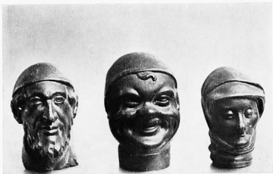
178 Livarna Dvor : Glaviči za sprehajalne palice, 1841, Ljubljana, Narodni muzej