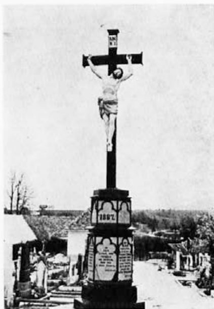
185 Livarna Dvor : Pokopališki križ, 1867, Zužemberk, pokopališče