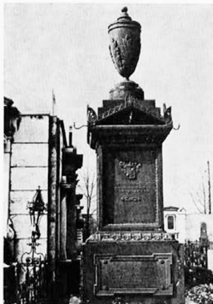
184 Livarna Dvor : Zoisov nagrobnik, okoli 1836, Ljubljana, Zale