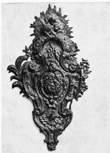
180 Livarna Dvor : Kropivček, druga polovica 19. stoletja, Ljubljana, Narodni muzej