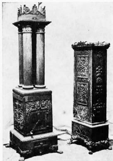
181 Livarna Dvor : Stebrna peč, druga polovica 19. stoletja(?), Novo mesto, Dolenjski muzej