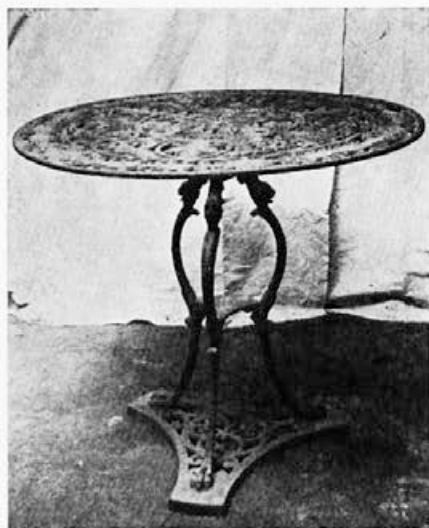
179 Livarna Dvor : Vrtna miza, druga polovica 19. stoletja, Novo mesto, Dolenjski muzej