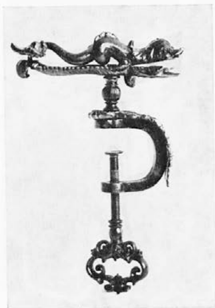
177 Livarna Dvor : Primež za šivanje, 1841, Ljubljana, Narodni muzej