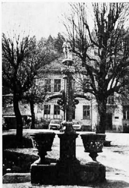
182 Livarna Dvor : Vodnjak v Višnji gori, 1872