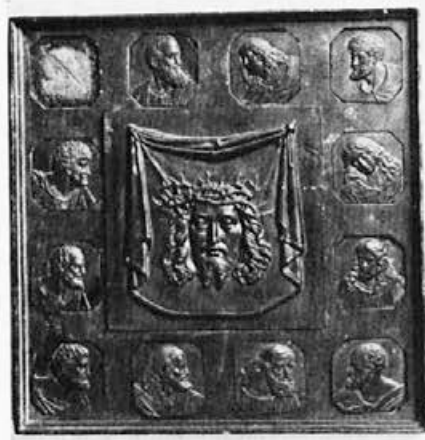
176 Livarna Dvor : Veronikin prt z apostoli, 1833, Ljubljana, Narodni muzej