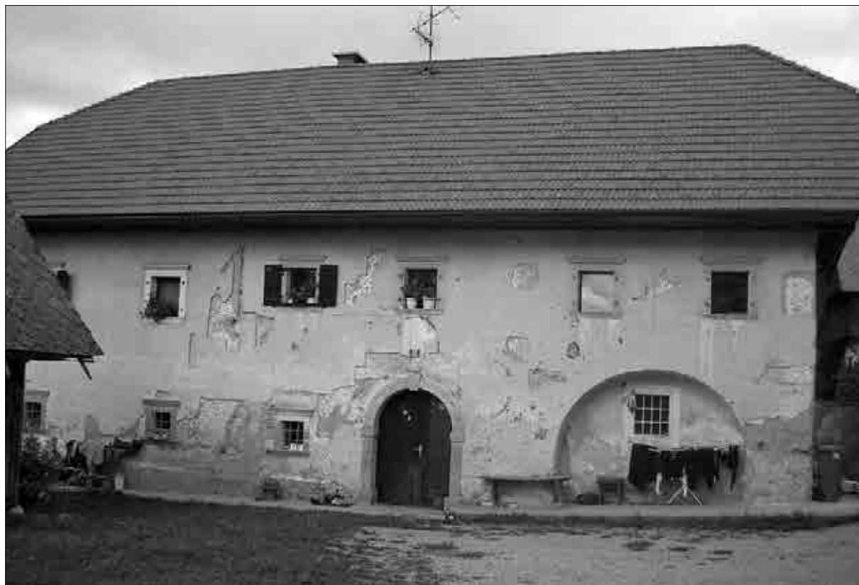
Mulejeva domačija, ki danes nosi naslov Bodešče 12, v času Mulejevih pa je bila to hiša Bodešče št. 11, kjer se je reklo pr' Sodarju.

moral prevzeti on. Že takrat se je pričel ukvarjati s trgovino, svetoval pa je tudi v pravnih in gospodarskih zadevah. 13