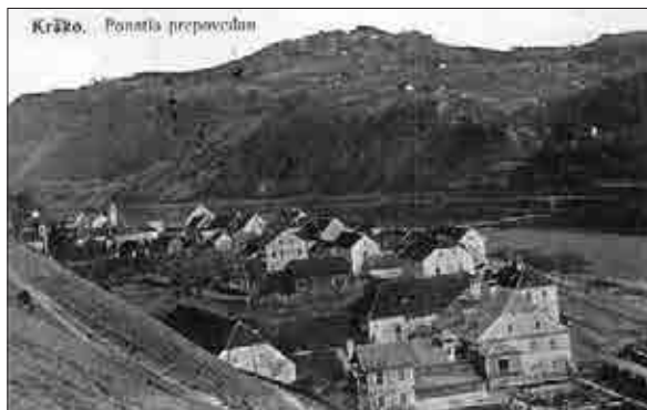
Hočevarjeva hiša v Krškem na razglednici iz leta 1927. Spredaj je viden tudi del vrta, za hišo pa gospodarska poslopja.

Kakšno je bilo mesto, ki sta si ga ambiciozna in sposobna mlada zakonca izbrala za prebivališče, in zakaj sta si izbrala Krško? Danes je nemogoče ugotoviti, zakaj ravno Krško. Dejstvo pa je, da je ravno njuno bivanje, predvsem pa njun denar bil eden od razlogov za razvoj in razcvet mesta konec 19. stoletja, ki je segel še globoko v 20. stoletje. Mesto Krško je »okrevalo« po neugodnem 18. stoletju, v katerem je izgubilo številne pravice, predvsem pa se je spopadalo s previsoko odmerjenimi davki in revnim prebivalstvom. Tako so Krško večkrat zamenjali za trg, čeprav je naselbina med Savo in Trško Goro dobila mestne pravice že 5. marca 1477. 55 Ob koncu 18. stoletja so predvsem zaradi dobre povezave po Savi in razvejane življenja v avstrijski monarhiji v mesto začeli prihajati različni ljudje iz vseh koncev 56 . S čolni in