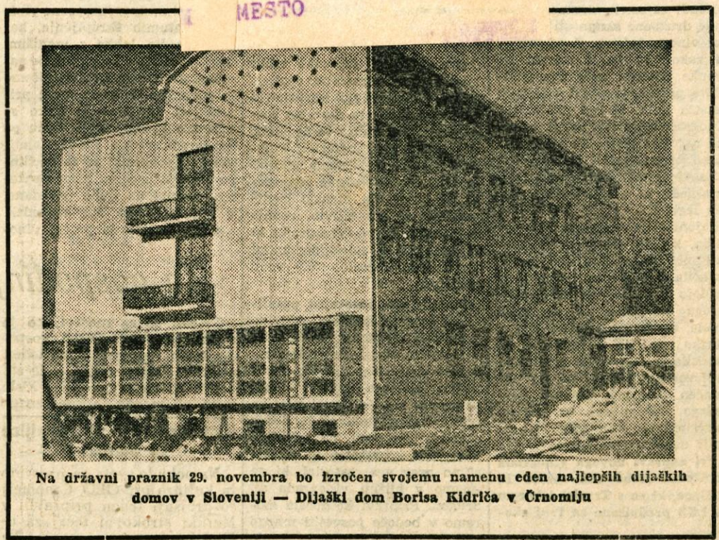
Na državni praznik 29. novembra bo izročen svojemu imenu eden najlepših dijaških domov v Sloveniji — Dijaški dom Boris Kidriča v Črnomlju