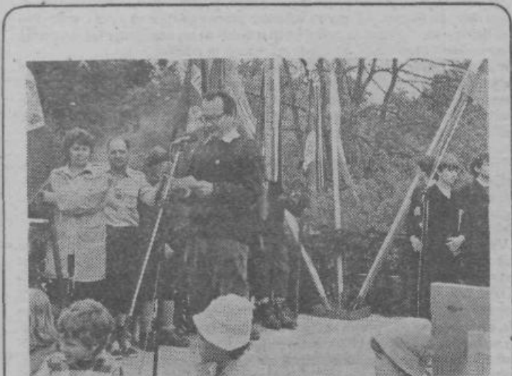
V nedeljo, 27. maja so se zbrali planinci na XIV. planinskem taboru na Polzevem. Večina obiskovalcev je prišla s posebnim vlakom iz Ljubljane do Žalne oziroma Višnje gore, nato pa peš do Polzevega.