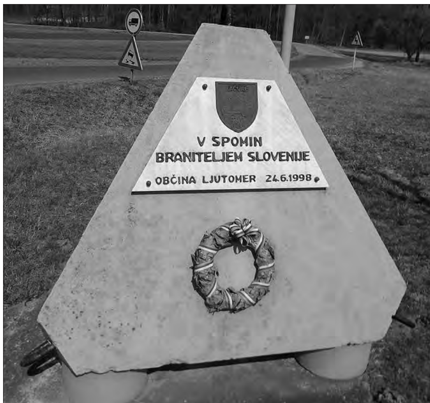
Spomenik spopada pri Mekotnjaku.

Posledično je poveljnik 7. PŠTO vsem podrejenim območnim štabom takoj ukazal, naj z vsemi možnimi ukrepi, vključno z uporabo orožja, jugoslovanskim silam (JLA, zvezni milici, zvezni carini) preprečijo prevzem nadzora nad mejnimi prehodi in kontrolnimi točkami. To naj bi dosegli predvsem z nenasilnim oviranjem dostopov do teh mejnih točk, pri čemer naj bi bile te blokade zavarovane tudi s sredstvi za protioleptni in protiletalski boj. 29