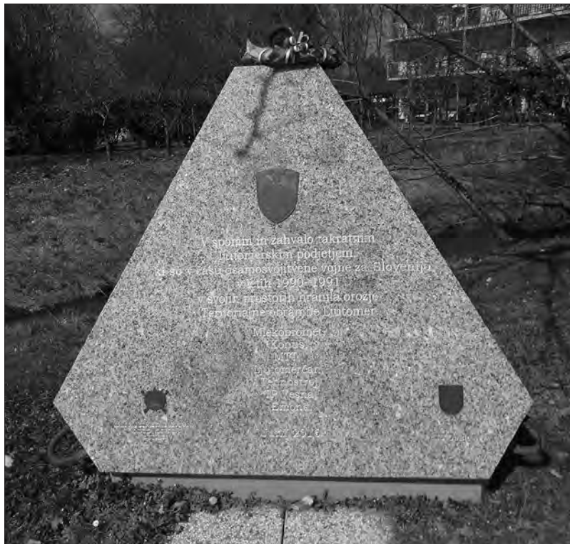
Spominsko obeležje (piramida) na Prešernovi cesti v Ljutomeru.