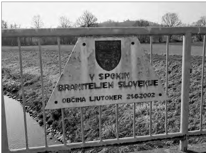
Spominsko obeležje na mostu čez Ščavnico v Pristavi.

gradom, je bilo poškodovanih zaradi streljanja. V tem boju sta sodelovala tudi 1. in 4. vod ljutomerskega odreda TO (poleg treh vodov ormoškega odreda). 34