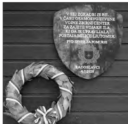
Zbirni center za ujete pripadnike JLA v Radoslavcih.