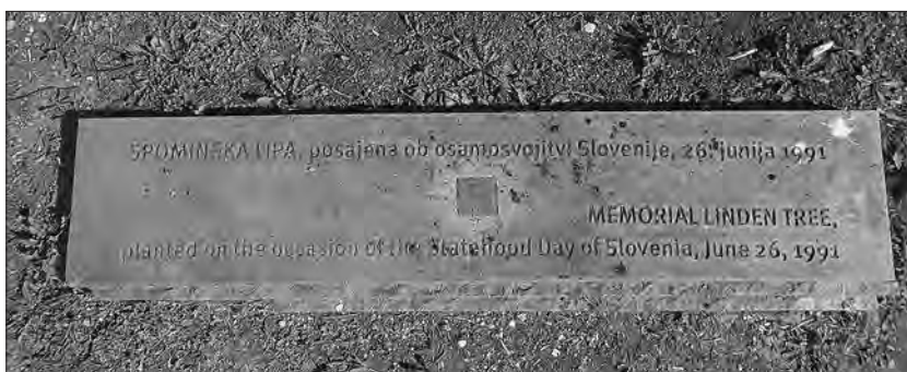
Lipa, zasajena ob slovenski osamosvojitvi na Starem trgu.