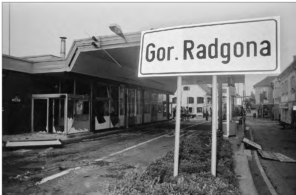
Mejni prehod v Gornji Radgoni 3. julija 1991 (foto: Tone Stojko, hrani Muzej novejšje zgodovine Slovenije).

več drugih motornih vozil. Slovenska stran je imela le šest ranjenih teritorialcev, dva civilista pa sta bila ubita, medtem ko je JLA imela osem ubitih in 28 ranjenih. Posledično je bilo izdanih pet spominskih bojnih znakov – Ormož, Gibina, Gornja Radgona, Kačure in Presika – ter spominski znak Ljutomer. Udeleženci bojev pri Radencih, Pristavi in Kogu pa so prejeli druga odlikovanja. 48