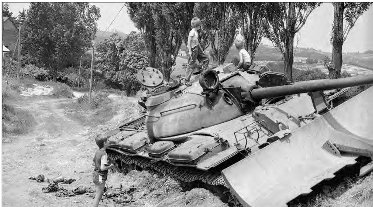
Uničeni tank JLA na Gomili pri Kogu, julij 1991.