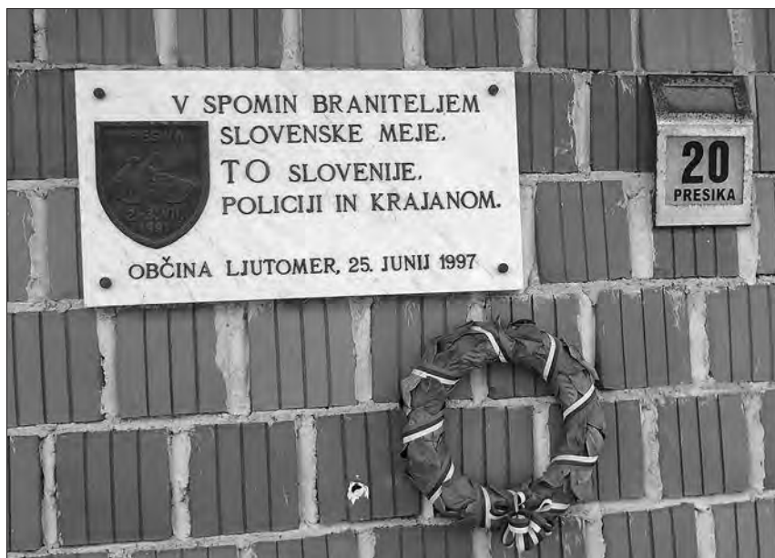
Spominsko obeležje na Presiki.