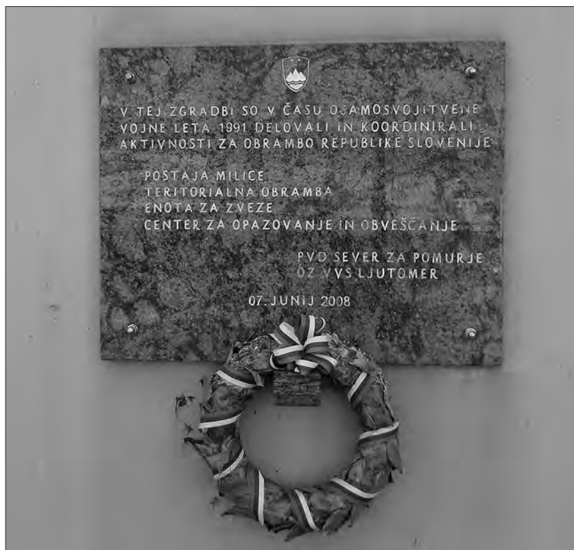
Spominska plošča na PM/PP Ljutomer (osebni arhiv avtorja).

merski območni štab imel na voljo 138 pripadnikov v šestih enotah, in sicer 46 pripadnikov dveh ormoških vodov v Pekrah, en ormoški vod (26 pripadnikov) in ljutomerski diverzantski vod (23 vojakov) v Ljutomeru; pontonirski vod Ljutomer (19 vojakov) je varoval sedeže ObmŠTO in oddelka za LO v Ormožu, Ljutomeru in Gornji Radgoni, del 6. odreda TO Gornja Radgona (24 pripadnikov) pa je bil na strelišču v Hercegovščaku. V poznejših dneh so se menjavale enote na omenjenih stražarskih položajih in na strelišču, kjer je potekalo usposabljanje. 24