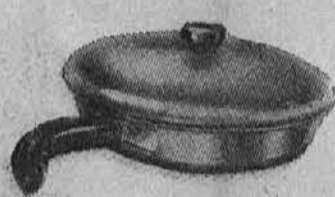
10" Covered French Skillet 6.30 12" Covered French Skillet 8.25