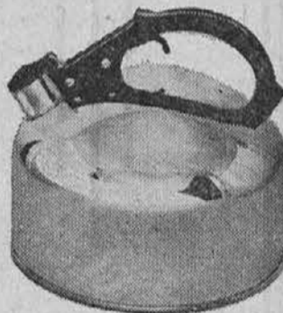
Whistling Tea Kettle 4.95

Tajnost uspeha "Revere" posode je debel bakren del spodaj, ki prepreči, da se le v enem kraju segreje in pokvari jed ko se pripali. Svetlikajoč "stainless steel," ki se skoro ne uniči . . . zato je ekonomično za kupiti. Prihrani čas, prihrani kurjavo, prihrani maščobe . . . in ima natančno balancirane, trdne ročaje iz hladnega "bakelite."