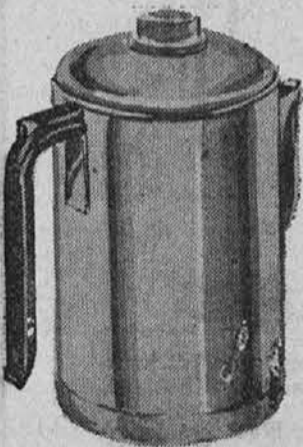
6-cup Percolator 7.60