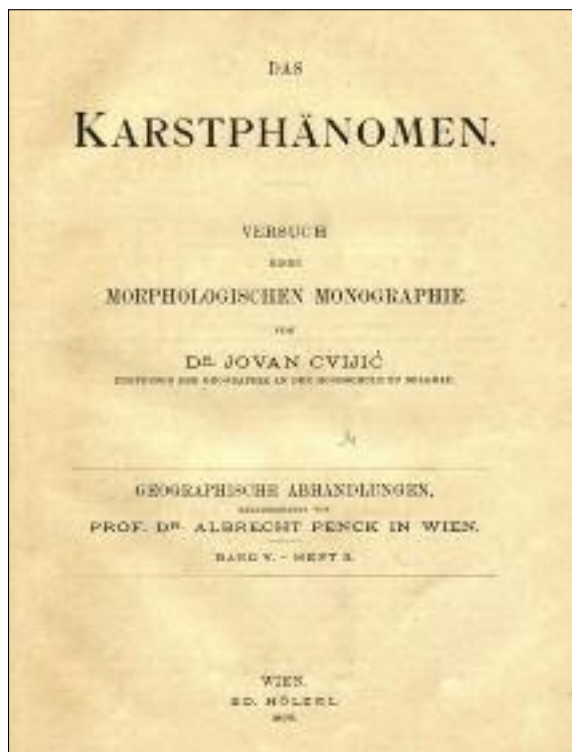
Slika 2: Naslovnica monografije Das Karstphänomen .