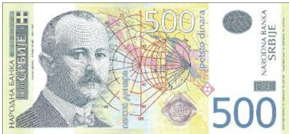
Slika 3: Da je Jovan Cvijić v Srbiji pomembna osebnost, med drugim priča njegova upodobitev na bankovcu za 500 dinarjev.