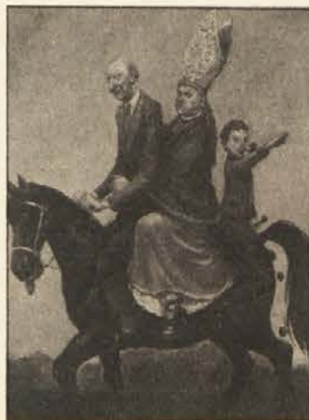
Cartoon je iz Deixovega „dnevnika“ - Mein Tagebuch.

Sreda, 7. 10. 1987, TV A1, 23.22 - Nasproti zatrditvam ljudskostrankarskega parlamentarnega kluba (ki je pred kratkim bil v Južni Afriki), da apartheida ni, naj služi dokumentacija „Mama, jokam“. Prikazuje predvsem boj mladih črncev in konflikte črnih sindikatov, ki so se ravno v zadnjem času močno zaostri-li. Oddaja se priporoča predvsem še tistim, ki lahkoverno verjamejo izjavam parlamentarcev ljudske stranke. Naj prispevek potrdi apartheid Južne Afrike in zatiranje črnega prebivalstva.