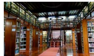
IZ ZAKLADNICE PTUJSKE KNJIŽNICE 21. 11. ob 19.00 Knjižnica Ivana Potrča Ptuj