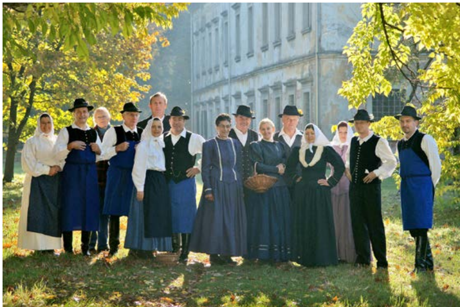
Folklorna skupina Bolnišnice Ptuj

Pomen ljubiteljske kulture je večplasten, velik pravzaprav, povezovalen ter medgeneracijski. Prav tako je tudi vloga DPD Svoboda Ptuj, v kateri smo ustvarili na stotine zgodb. Nekatere so odplesane, druge zapisane, spet tretje uprizorjene, lahko so naslikane ali uglasene. Ne pozabimo pa, da so kultura ljudje in prav tako DPD Svoboda Ptuj. Zato smo spodnje vrstice namenili prav njihovem pogledu na umetnost, ki jo še posebno obožujejo.