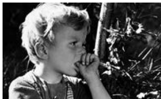
SLOVENSKI TEDEN FILMA: NE JOČI, PETER 12. 11. ob 18.00 Mestni kino Ptuj