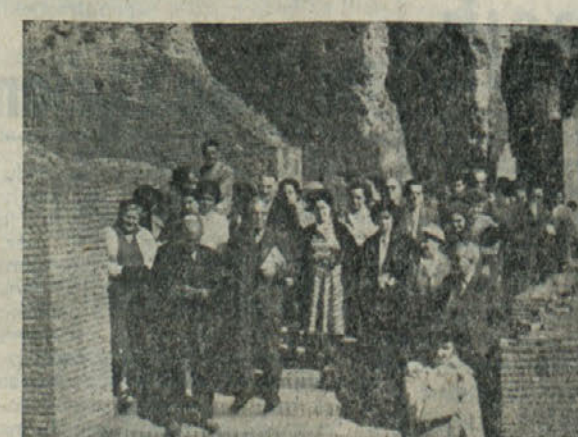
Skupina jugoslovanskih filatelistov v rimskem Colosseumu