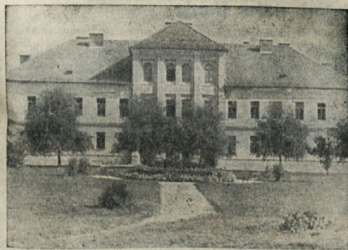
Šola Mirka Bračiča v Kočevju

Dela imajo prav zaradi ugleda, ki so si ga pridobili s solidnim delom, vedno dovolj. Imajo tudi tričlanski upravni odbor, delavski svet pa sestavljajo vsi člani kolektiva.