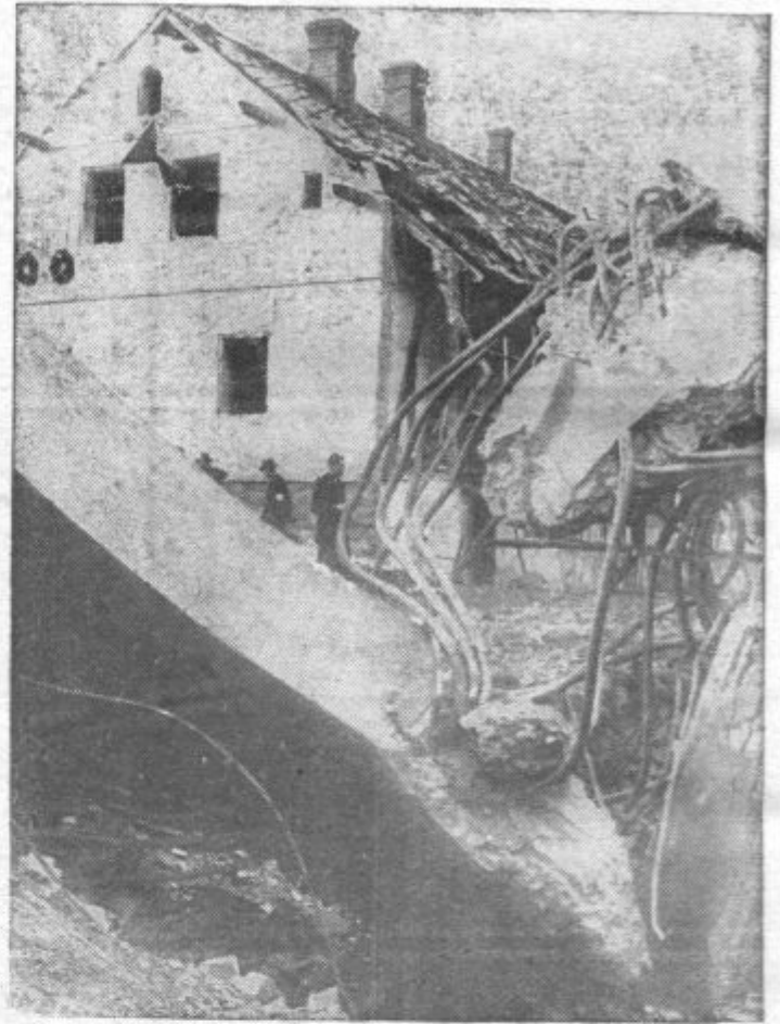
Pri Breitenfirtu so neznanci pognali most v zrak preden so nemške čete zasedle kraj