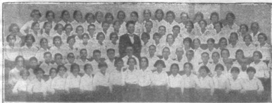
TRBOVELJSKI SLAVČKI so se poslovili od Bolgarije, kjer so več tednov gostovali in se vrnili v domovino