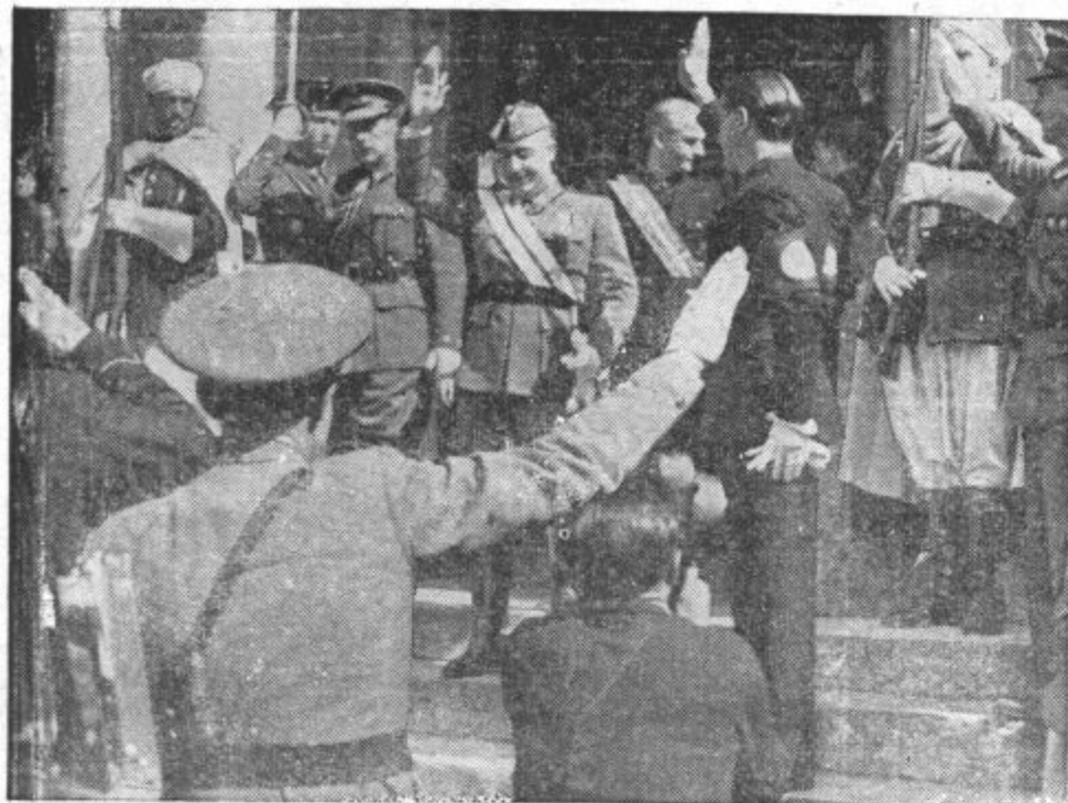
TAKO POZDRAVLJAJO V ŠPANJLI General Franco odhaja iz glavnega stana svoje vojske v Burgosu