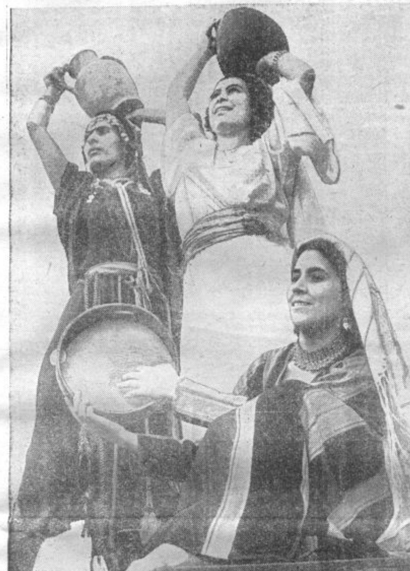
KAKOR IZ SVETEGA PISMA. Iz Palestine so prišle po Evropi židovske plesalke, ki predstavljajo razne prizore iz svetega pisma. Ta čas se mudijo v Londonu in zbuja veliko pozornost