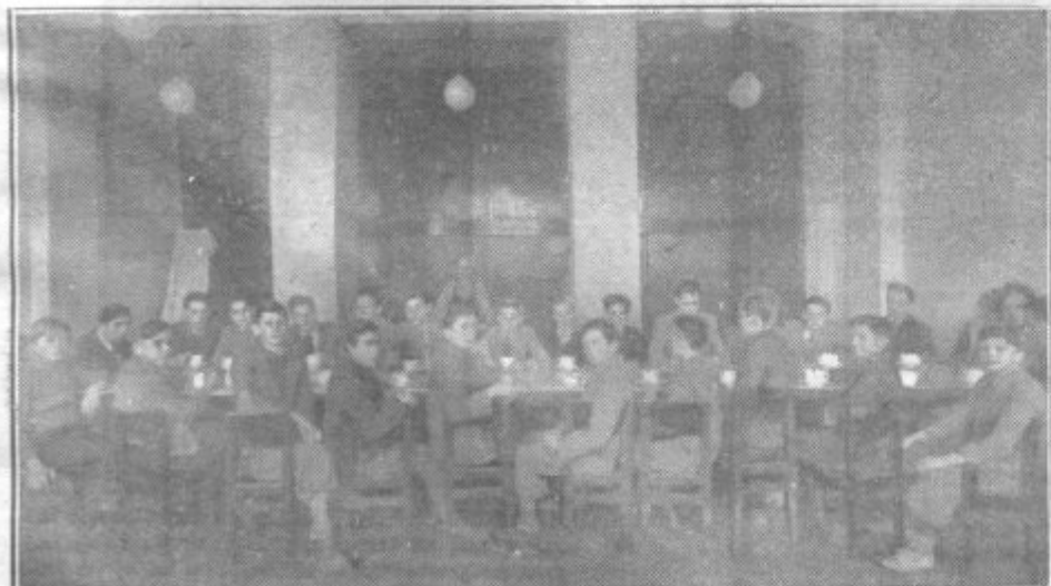
Na bežigradski gimnaziji v Ljubljani dobiva dnevno okoli 40 dijakov obilen zajtrk.