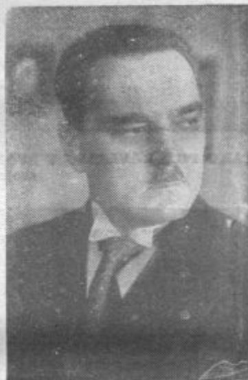
dr. MILAN STOJADINOVIĆ, predsednik vlade in Jugoslovenske radikalne zajednice ter nosilec liste JRZ