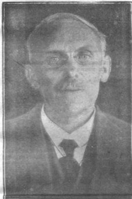
Dr. VLADKO MACEK, predsednik Hrvatske seljačke stranke in nosilec liste Združene opozicije