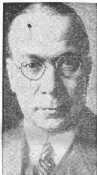
Dr. Chvalkovsky, novi čl. minister za zunanje zadeve