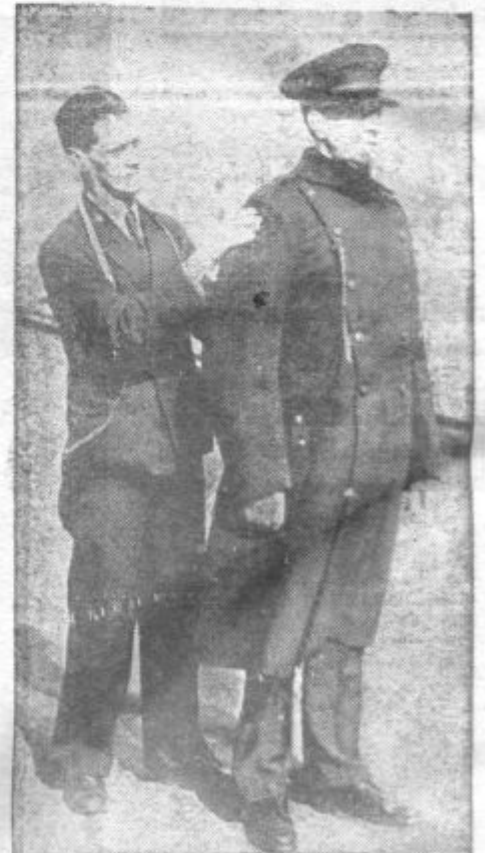
Nad tisoč mož Britske legije je bilo pripravljeno na pot v plebiscitno ozemlje ČSR. Sporazum med Nemčijo in ČSR pa jih je odvezal dolžnosti