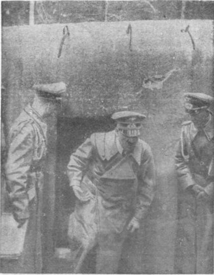
Nemški kancelar Hitler si je v Kreuzbachu pri Friedlandu v sudetskem ozemlju ogledal vojaške utrdbe, katere so morali Čehi prepustiti novim gospodarjem dežele