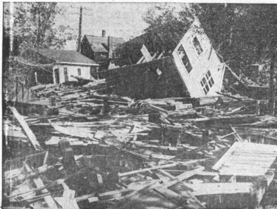
ŠODA LESENIH HIŠ. Zadnji ciklon v Ameriki je povzročil ogromno škodo. Na sliki vidimo posnetek s peščin v Oaklandu, kjer je neurje prevračalo lesene hiše