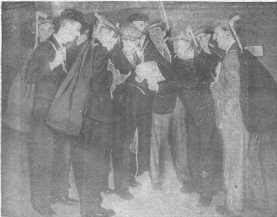
PRED ODHODOM V ČSR. Člani Britske legije, določeni za rediteljsko službo na glasovalnem ozemlju ČSR, dobivajo pred odhodom iz Anglije zadnja navodila, kakšne so njihove dolžnosti