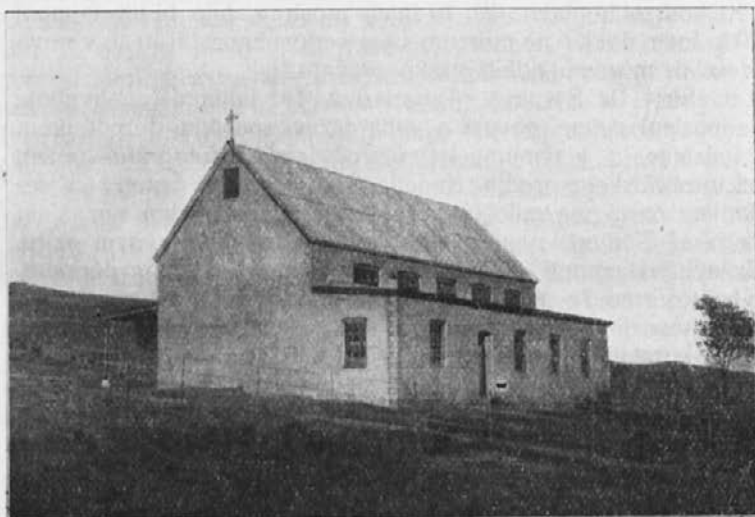
Cerkev Žalostne Matere božje v Mbabane.