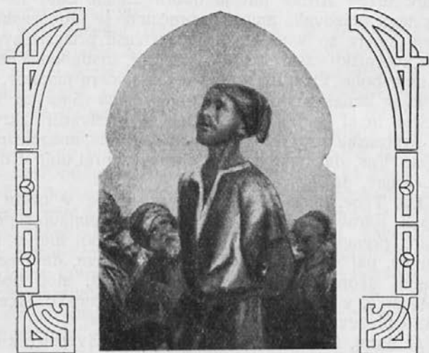
Častitljivi Jeronim, ki je dne 18. septembra 1569 v Alžiru umrl za sv. vero.