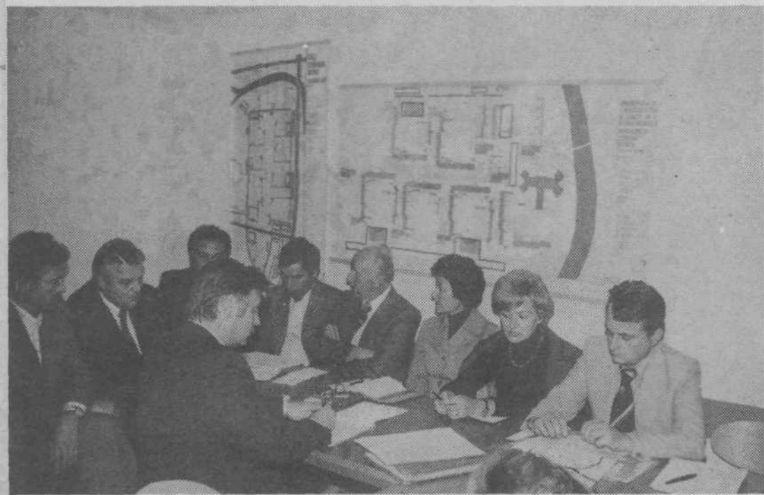
Posvet v KS Štepanjsko naselje: nujna so vlaganja v družbeni standard

V prihodnji številki bomo nadaljevali z zapisi o posvetovanjih v preostalih krajevnih skupnostih.