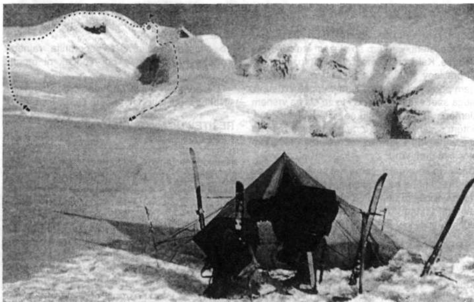
Šotirišče pod Lautarom; na gori je označena smer vzpona in sestopa, krožec kaže lego ognjeniškega dimnika

Vrh grebena! Nedaleč proti severu se končuje - v vrh gore. Samo še nerodno prečenje do kotanje pod njim, od tam nekaj strmine na vršno sleme, pa izgajen pločnik po njem ju še ločijo do vrha. Onkraj grebena se pod goro samó še nizki oblaki pasejo v čredi nad Tihim oceanom in globokimi fjordi, v katere se iztekajo reke in ledeniki. Tudi tokraj, na vzhodu, se doli umika prejšnji vsiljivec in izginja v navidezni nič.