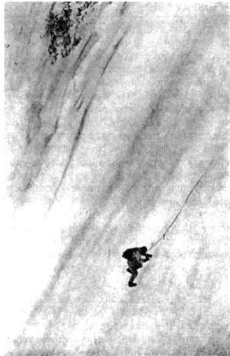
Brez cepina v strmini ledene stene