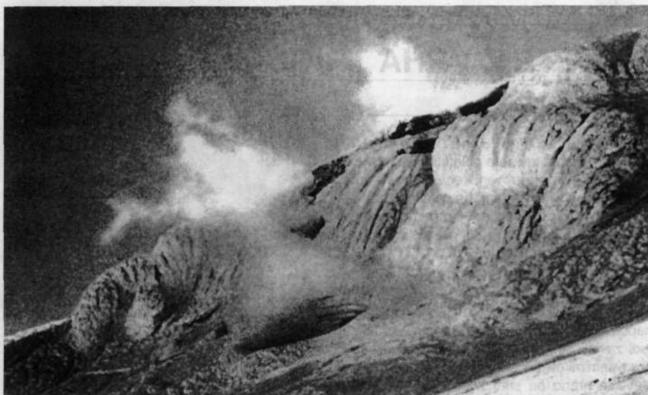
Ognjeniški dimnik pod vrhom Lautara

tem potrjeno z dokazi in je vnešenih vanj nekaj več podrobnosti.