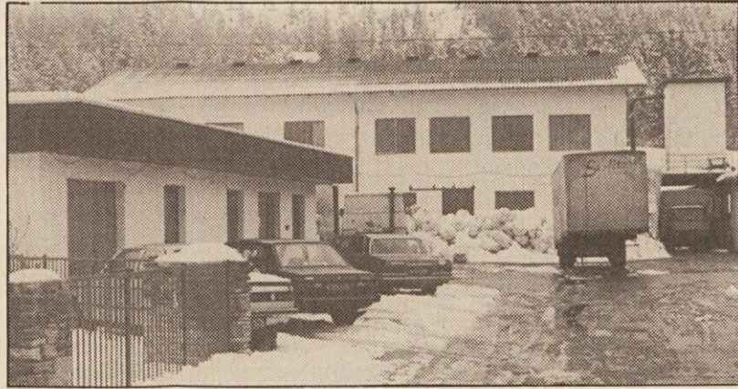
Stefitz namerava odpustiti 60—70 delavcev.