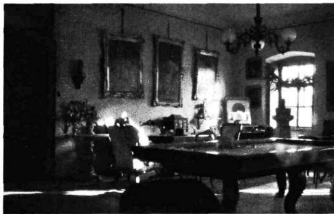
Salon v fužinskem gradu z Langusovimi slikami in sloviło biljardno mizo