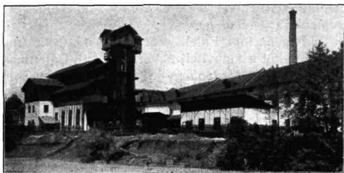
Papirnica Vevče in tvornica lesovine