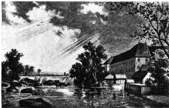
Grad Fužine pri Ljubljani okoli l. 1870., v ozadju slapovi Ljubljanice