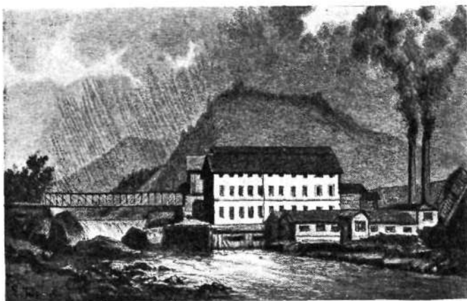
Stara papirnica v Medvodah, v ozadju savski slap na Verju

zanje, 1 stroj za sukanec. Parni stroji so se kurili s šoto in premogom. Surovin se je porabilo: 700 do 1000 centov ovčje volne, 200 do 400 centov umetne volne, 800—1000 centov bombaževih sprejenih niti, barhenta, nogavic in drugih odpadkov. Tvornica je izdelovala izborno sukno in koce, zlasti za vojaštvo, poleg tega še loden, velurje, klobučevino za papirnice, vato, plahte i. t. d. Nje izdelki so se prodajali po Kranjskem, Koroškem, Štajerskem, v Istri in Dalmaciji, v Tirolah, Spodnji in Gornji Avstriji, Šleziji, Galiciji, Ogrski, Hrvaški in celo na Rusko. Tvornica je bila odlikovana na razstavah v Mariboru l. 1865., na Dunaju l. 1866. in v Trstu l. 1871. Zaposlenih je bilo v njej 100 do 130 moškega in ženskega delavstva.