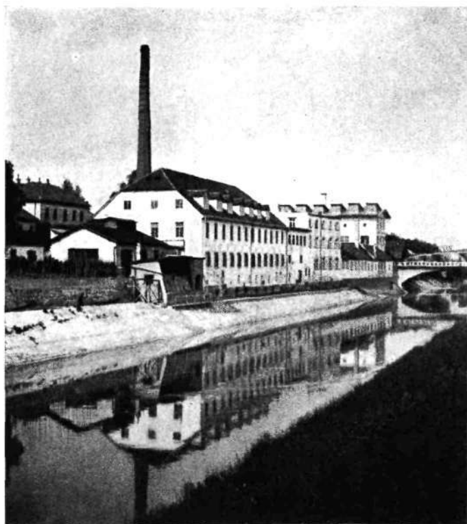
Tvornica kocov Terpinc in Zeschko, sedaj Hribarjeva tvornica pletenin v današnjem stanju. Del tvornice, nad katerim se dviga dimnik, je v bistvu le malo spremenjen