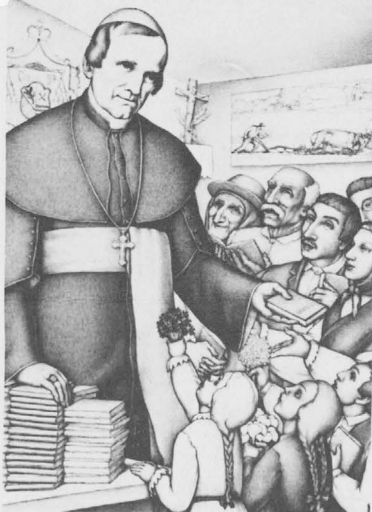
Tone Kralj: Božji služabnik Anton Martin Slomšek