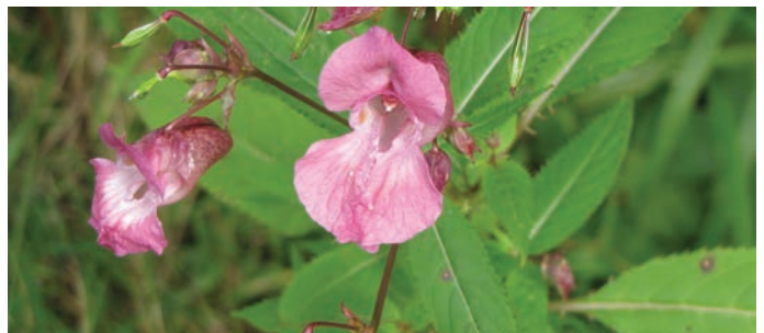
Žlezava nedotika