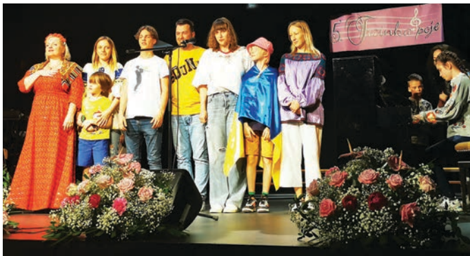
Dobrodelna nota tokratne 5. revije Trzinka poje je bila namenjena glasbenikom iz Ukrajine.