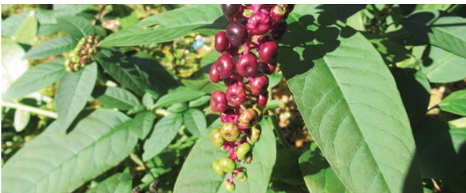
Plod navadne barvilnice