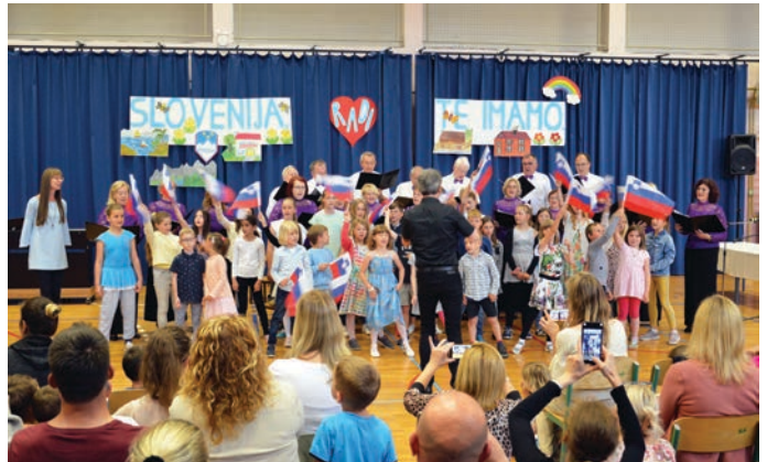
9. junija so v telovadnici šole s kulturno prireditvijo »Slovenija, radi te imamo« počastili dan državnosti.

»Prednostna naloga letos je bila spodbujanje branja pri vseh trzinskih osnovnošolcih. Izvedli smo ga z Medgeneracijskim bralnim tek-