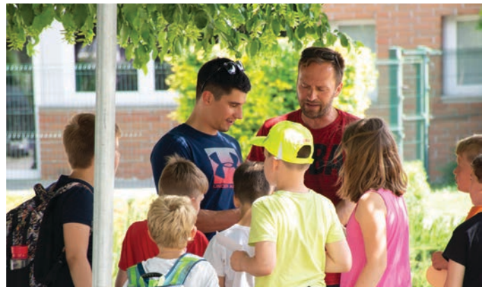
Učitelji podaljšanege bivanja so po dveh dolgih letih znova organizirali »Podaljšanjado«, na kateri je učence podaljšanege bivanja obiskal alpski smučar Žan Kranjec.