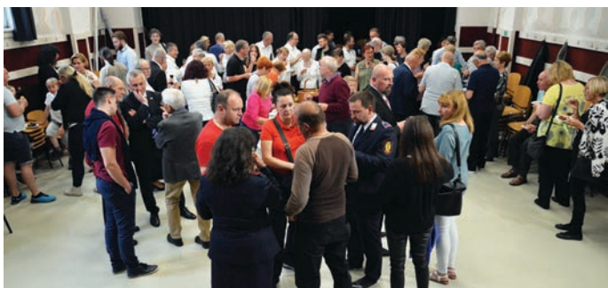
Slavnosti je sledilo sproščeno druženje ob jedachi in pijači.