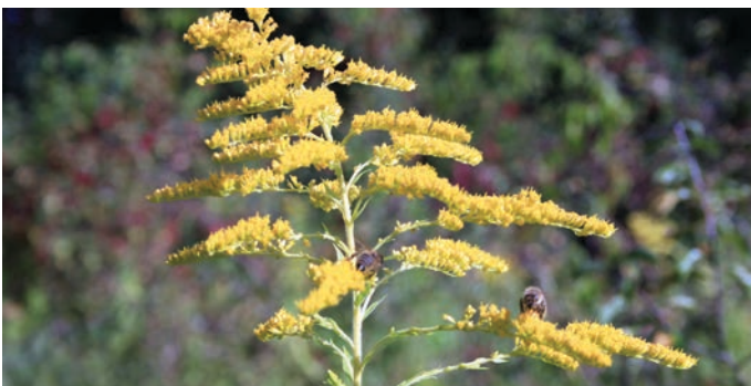
Zlata rozga