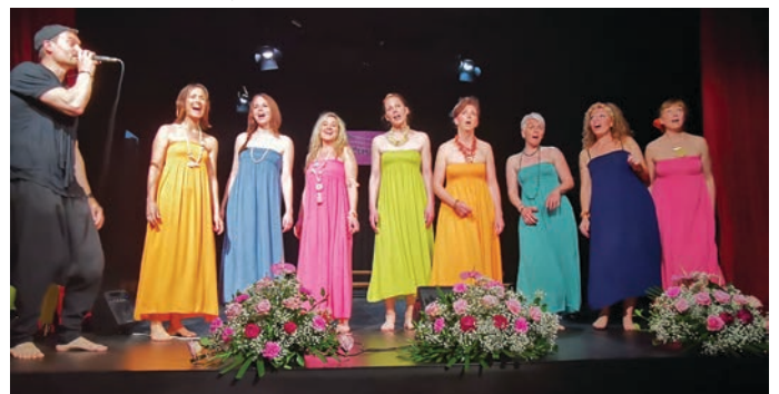
Čivke tokrat v barviti afriški podobi

Izjemno prijetno razpoloženje in odlični nastopi gostujočih in domačih pevcev so poskrbeli za še en zelo prijetno preživet nedeljski popoldan. S tem se je po besedah Štefke Prelc v petih letih na trzin-