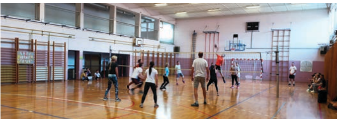
Učenci (večina iz 8.b), starši in učitelji so se po dveletni prekinitvi 12. maja srečali na tradicionalnem športnem druženju Žogo ti podam. V telovadnici so v skoraj dvournem igranju odbojke zmago slavili starši, a se učenci (nekaj jih trenira odbojko) in učitelji niso zlahka predali.