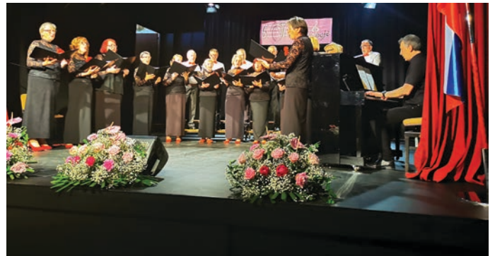
Mešani pevski zbor Ivan Hribar in spredaj Trzinke, glavne pobudnice pevskega dogodka, ki je v petih letih postal trzinska stalnica.