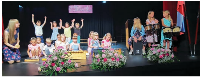
Prisrčen nastop prvošolčkov Osnovne šole Trzin je navdušil občinstvo.