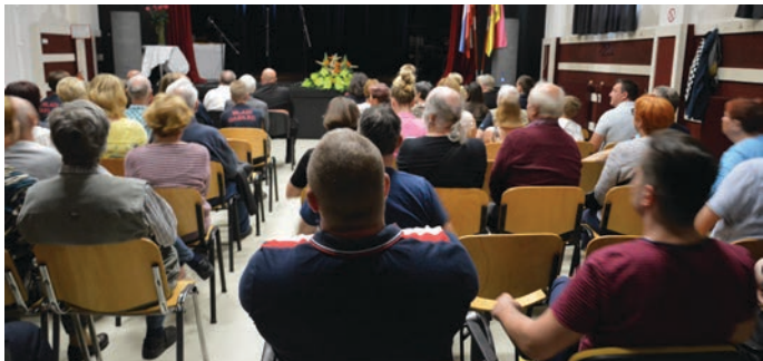
Občani in gostje so ponovno napolnili dvorano Kulturnega doma, saj ni bilo več covidnih omejitev.