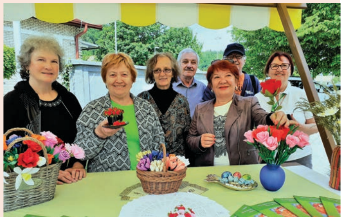
Obisk podpredsednice društva »Z roko v roki« Kranj

Besedilo in foto: Jožica Trstenjak, Skupina Naše vezi Trzin