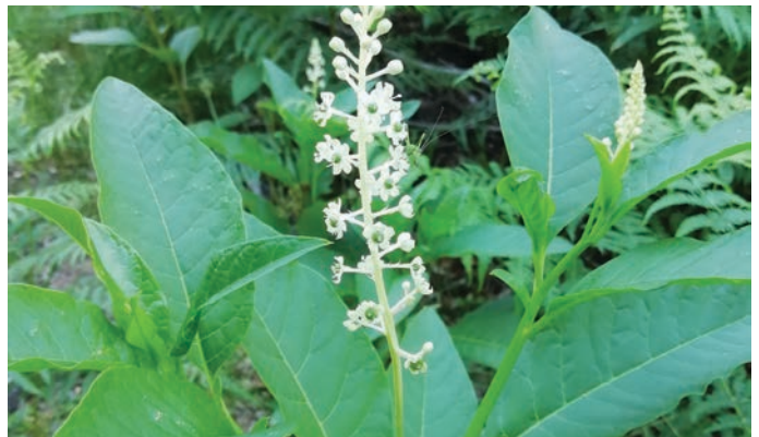
Cvet navadne barvilnice

Pregledna karta rastišč s povezavo do spletne strani ( https://www.trzin.si/sl/content/obcina/akcijski-nacr-ity.html ), kjer so na voljo zloženke invazivnih tujerodnih vrst z metodami odstranjevanja, ter druge ažurne informacije.