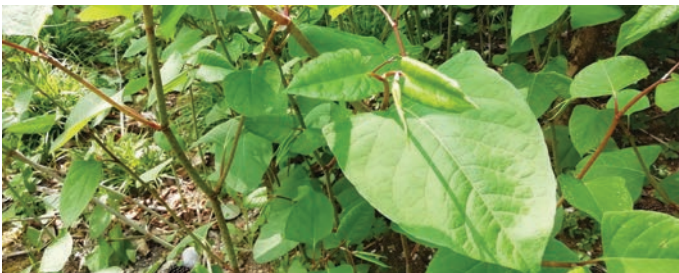
Japonski dresnik

Ker so za preprečevanje širitve območij ključni pravočasno in sprotno odstranjevanje ter redno spremljanje območij, smo lani začeli akcijo »Posvoji rastišče ITV«. Letos si bodo rastišča invazivnih tujerodnih vrst razdelila nekatera lokalna društva. Odstranjevala bodo dvakrat letno. Termini akcij bodo objavljeni na spletni strani občine in društvenih spletnih straneh.