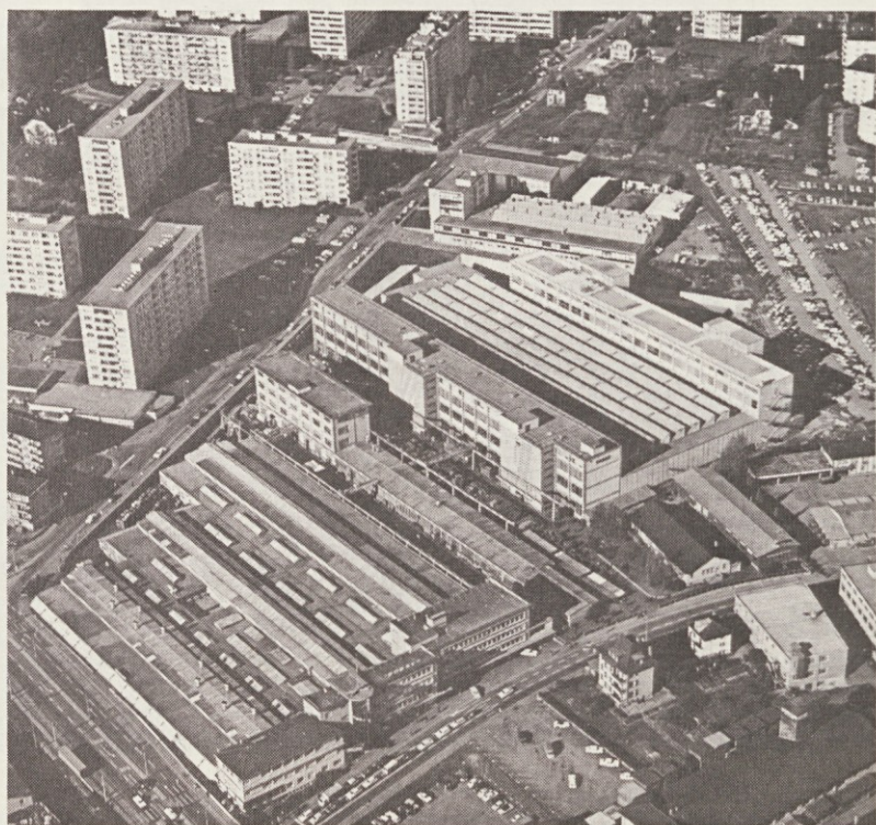
Tovarniška poslopja in stanovanjski bloki podjetja Bobst Graphic v Lausanni