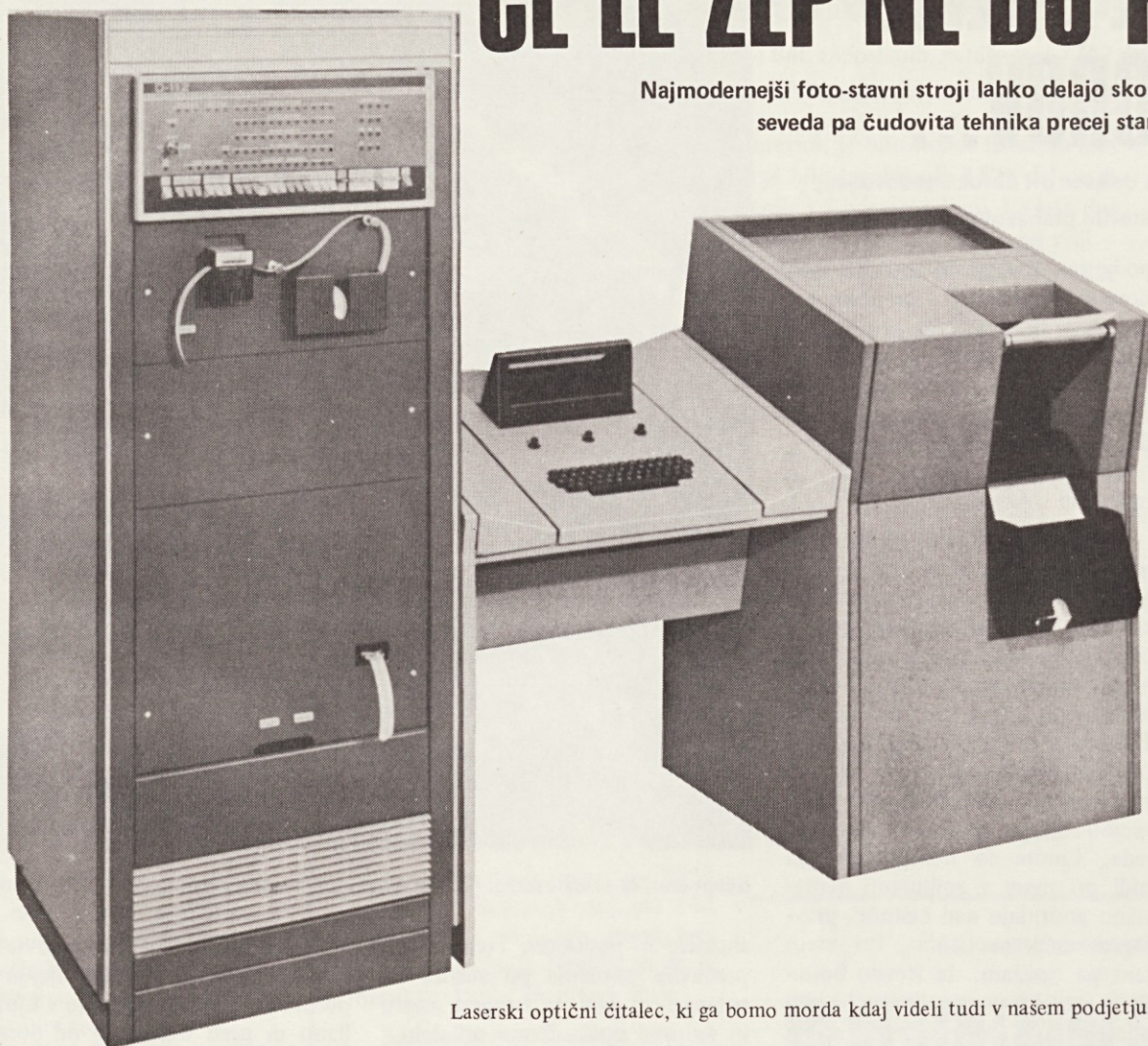
Laserski optični čitalec, ki ga bomo morda kdaj videli tudi v našem podjetju

Najmodernejši foto-stavni stroji lahko delajo skoraj „čudeže“, seveda pa čudovita tehnika precej stane