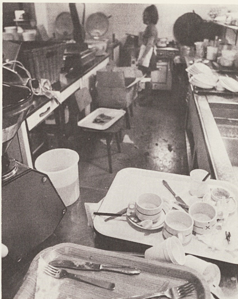
Slišali smo, da so tla v menzi pomita le enkrat tedensko . . .

„V Ljudski pravici pravijo, da se ne da nič storiti, da bi bilo v menzi nekoliko več reda. Imajo celo komisijo, ki naj bi nadzorovala čistočo in red, morda celo jedilnike, vendar rezultatov ni. Člani komisije se pač ne hranijo v menzi! Tiskarna prispeva del sredstev, tako na primer „pokriva“ vso režijo (prostori, elektrika, plin, ogrevanje . . .), pa ne more napraviti reda. Ljudje so nezadovoljni in tudi pri meni v ambulanti neprestano godrnjajo nad čistočo, pravzaprav nad nečistočo. Pri vsem tem pa opažam, da število bolniškega staleža zaradi prebavnih obolenj raste in je že zelo visoko, to pa ni več šala. Pojavljajo se razni čiri, vnetja želodčne in črevesne