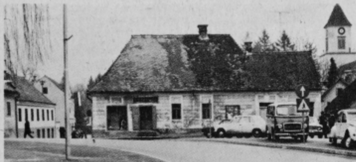
Na prostoru, kjer na Mestnem trgu v Ormožu stoji ta stara hiša in v kateri ima Zarja svojo prodajalno „Steklo-barve“ bo nekega dne stala nova večnadstropna blagovna hiša.

„Ograd“ Ormož. V smislu povezovanja trgovske dejavnosti prav ta čas preučujejo možnosti za povezano trgovskih podjetij Izbira in Merkur, Ptuj ter Zarja, Ormož. Nekaj so se pogovarjali tudi že o tretji varianti, to je Zarja, — IGP Ograd Ormož — Mercator Ljubljana. Pred nedavnim so se pri Zarji oglašili tudi predstavniki trgovskega podjetja ABC iz Ljubljane. Načrtujejo pa