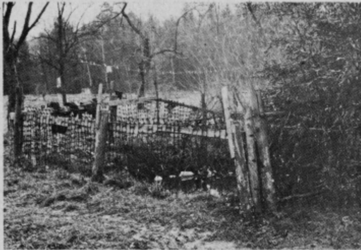
Mlaka, v kateri je našlo smrt že šest otrok

ta mlaka predstavljala nevarnost za v bližini igrajoče se otroke, ukrenili pa niso nič, da bi to nevarnost zmanjšali ali celo odpravili. Obdolženi bi se bili morali zavedati, da lahko tudi v bodoče pride do nesreče. Tako je njihova lahkomišelnost pripeljala do težkih