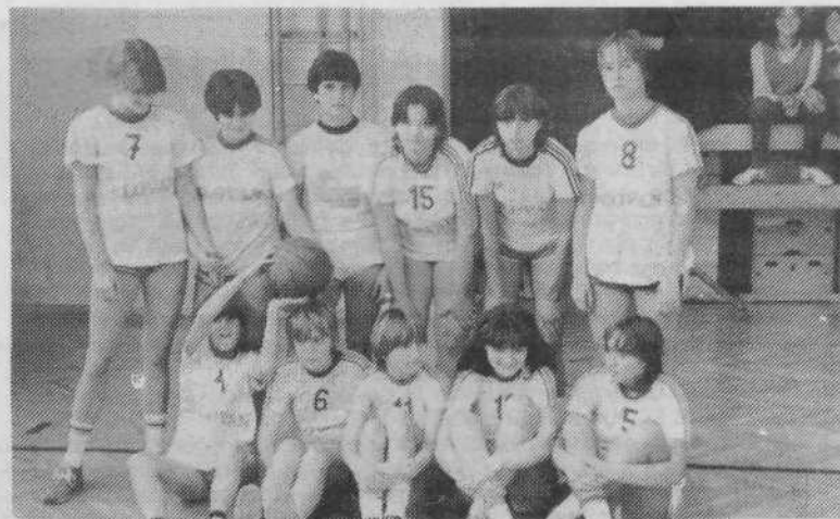
Ekipa košarkaric z osnovne šole Toneta Čufarja

Vrstni red: 1. ŠSD P. Voranc, 2. ŠSD T. Čufar, 3. ŠSD Ledina, 4. ŠSD M. Vrhovnik, 5. ŠSD J. Potrč, 6. ŠSD T. Tomšič, 7. ŠSD Prule