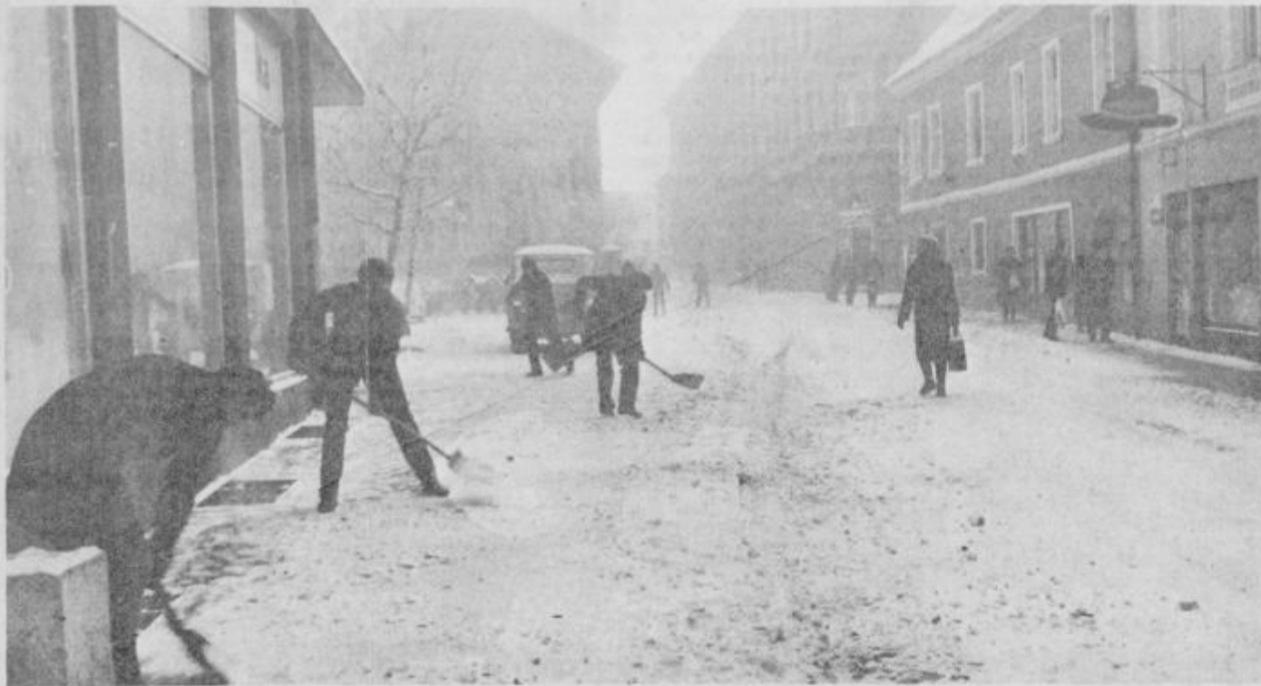
Takšno je bilo videti jutro po novozapadnem snegu in močnem mrazu. V Lackovi ulici so imeli največ dela trgovci.