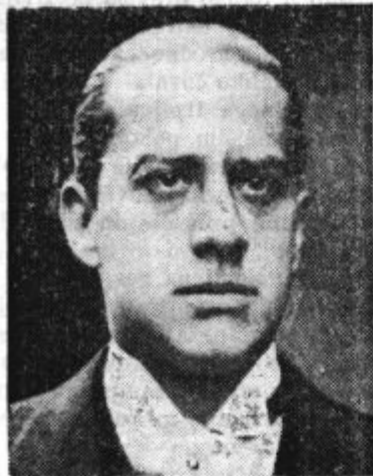
Italijanski zunanji minister grof Ciano, ki je pomagal razsojati na dunajski konferenci o usodi Slovaške in Podkarpatske Rusije.

Južno od Bratislave teče sedaj meja ob železniški progi Bratislava—Novi Zamki do Šale, ki pripade Madžarski, od tu zavije proti severovzhodu, tako da teče južno od Nitre, kjer seka železniško progo severno od Vrable in gre dalje v severovzhodni smeri nad Levicami, ki prav