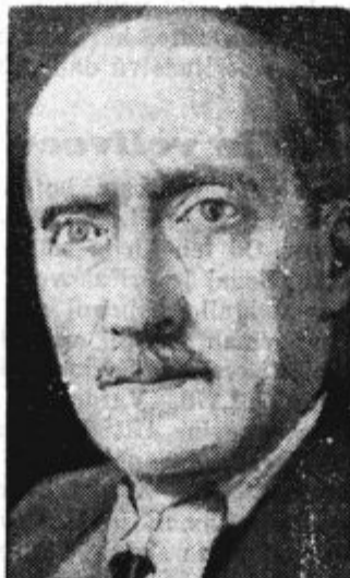
Češkoslovaški zunanji minister dr. Chvalkovsky, ki ga je usoda izbrala, da je moral vzeti na znanje odlok, ki je odcepil od republike okrog milijon duš.

Trpke, pa vsestransko resnične besede, o katerih velja razmišljati. Že neštetokrat smo v »Kmetem listu« naglaševali pomen in važnost resnično demokratskega sporazuma v mednarodnem in v domačem življenju, na političnem in zlasti tudi na gospodarskem polju. Tudi danes ponavljamo, da je to ideal vsake resnične kmetijske politike. Zato želimo domovini in Evropi, da bi ta kmetijski ideal kmalu uresničil in dosegli. To bi res pomenilo mir, ki bi bil blagoslov za ves svet.