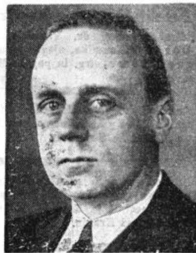
Nemški zunanji minister v. Ribbentrop je kot član dunajske konference podpiral italijansko stališče v korist Madžarske.

Nemško propagandno ministrstvo je namreč sporočilo, da o takih ukrepih ničesar ne ve.