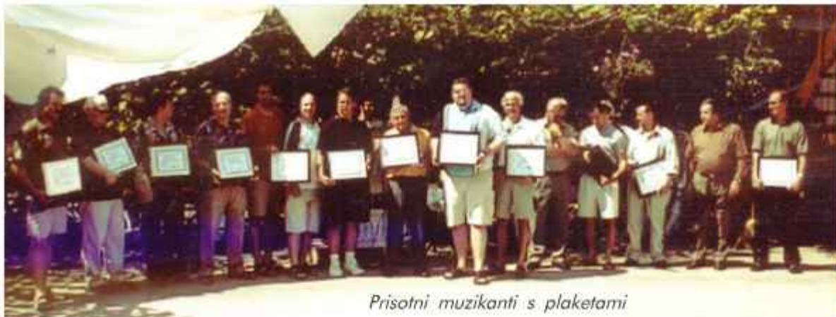
Prisotni muzikanti s plaketami

Imeli smo izredno lep dan in upamo, da bo ostal vsem v trajen in lep spomin. Društvo SAVA pa se iskreno zahvaljuje svojim članicam in članom ter vsem drugim, ki so pripomogli k uspehu tega edinstvenega srečanja.