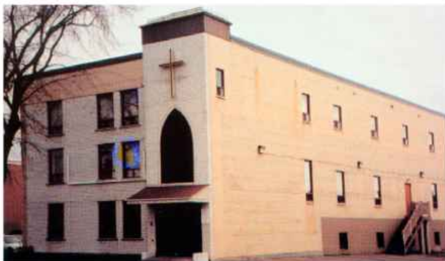
Cerkev sv. Vladimirja v Montrealu

Slovenska župnijska skupnost v Montrealu je v nedeljo 11. julija obhajala Slovenski dan -praznik narodnih korenin in kulturne dediščine.