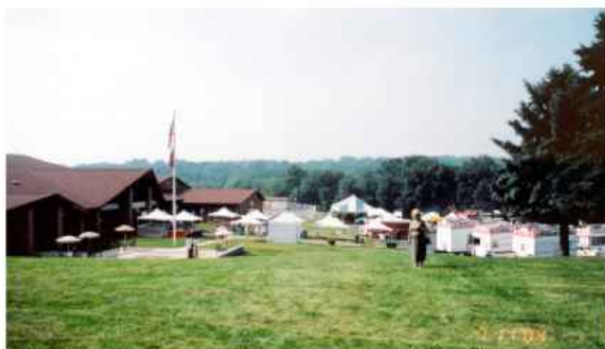
SNPJ recreation centre - Enona Valley PA