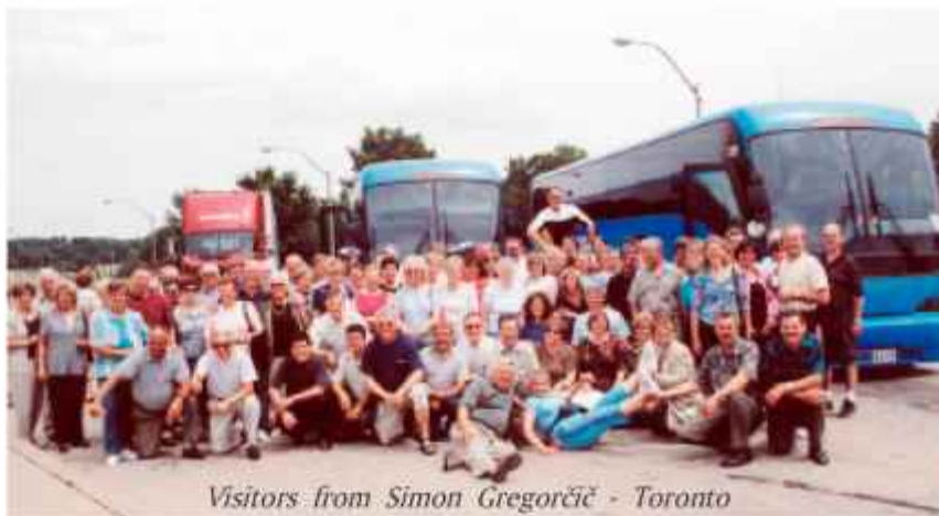
Visitors from Simon Gregorčič - Toronto

On July 9, 10, and 11, 2004 SNPJ members and friends celebrated a century of success on their 500-acre Recreational center in scenic Enon Valley, Pennsylvania, USA. Besides thousands of SNPJ members and friends from all over the USA, over 250 Canadian Slovenians travelled in five busses and private cars from Ontario, Canada to Enon Valley PA., to pay tribute and to celebrate with fellow countrymen.