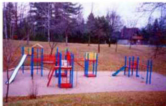
Na slikah vidite dom na Holiday Gardens, ljudi pri maši in lepo urejeno otroško igrišče