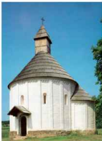
Selo v Prekmurju Romarska okrogla kapela s polkrožno aspido je nastala v 13. stoletju.