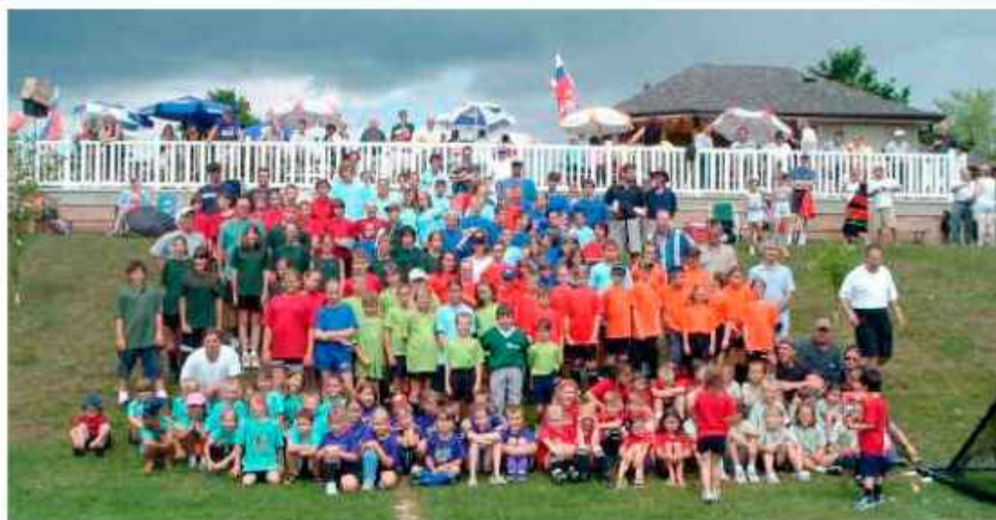
Del mlajših tekmovalcev, ki so se udeležili tekmovanja na Slovenskem letovišču