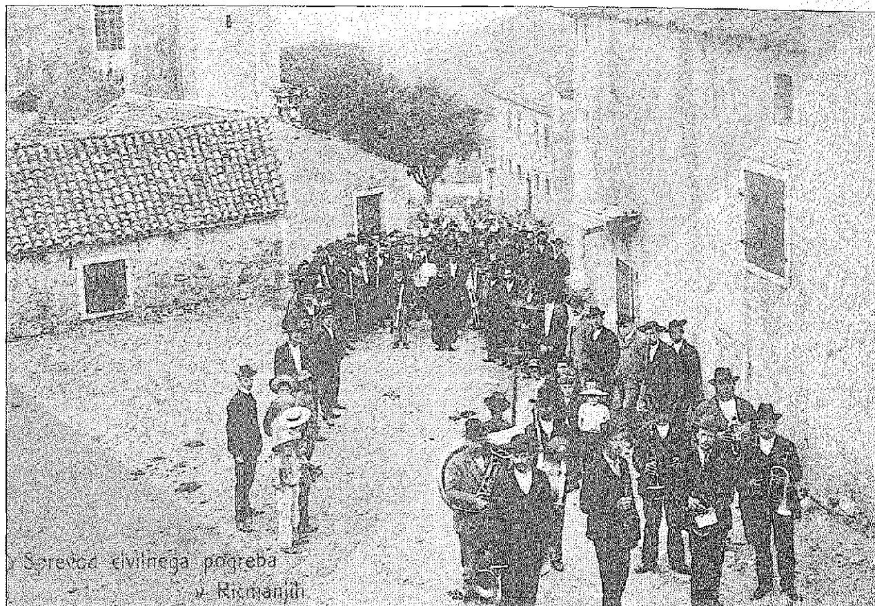
Srečevski civilnega pogreba v Romanjoli