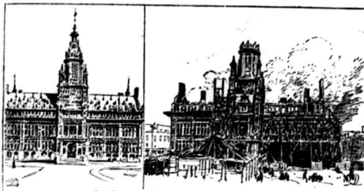
Das Rathaus in Schaebeck vor und nach dem Brande.

Krasni rotovf mesta Schaebeck pri Büselsau v Belgiji je te dni pogorel. Zgrajeno je bilo to velikansko poslopje pred okroglo 20 leti. Požar je uničil tudi mnogo dragocenih slik in arhiv. Blagajno, v kateri je bilo 3