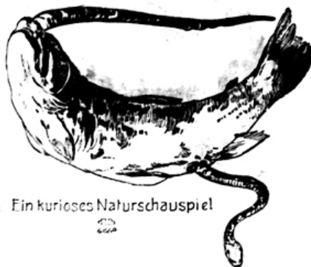
Ein kuriosos Naturschauspiel

Veĥni boj v naturi kaže dostikrat prav čudne oblike. Eno takih prikazen nam predstavlja današnja slika. Neka požrešna riba (postrv ali forela) požrla je v vodi veliko kaĥo-belouško. Seveda ni mogla krepke kaĥe premagati. Kaĥa je zmuznila skozi celo truplo ribe in prišla z glavo pri afterju vun. Konĥno so jo ribini zobje vstavili. Obe živali so tako, kakor jih kaže naša slika, žive vjeli.