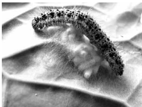
Slika 2: Gosenica kapusovega belina in bube kapusovega goseničarja na listu zelja

Figure 2: The caterpillar of Cabbage Butterfly and pupae of wasp of Cabbage Butterfly