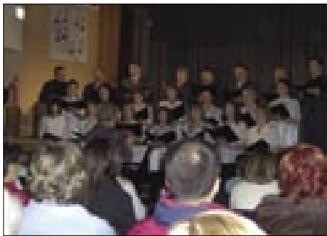
Mešani pevski zbor A. Pavel na odri v Trbovljah