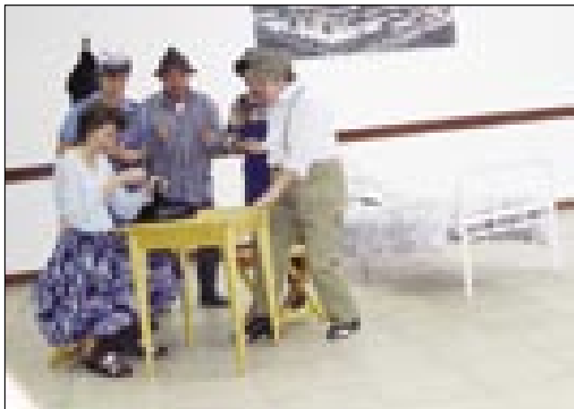
Veseli pajdaši so zošpilali igro „Najvekša vrejdnost“

Tau tü vejmo, ka je lüstvo ležej vküp sprajti v domanjom krajji, gdé žive. Zatau smo na djesen planirali srečanje z njimi doma. Za 1. srečanje z mosonmagyaróvárskimi Slovenci smo si odebrali soboto, 17. november. Tau pa vse