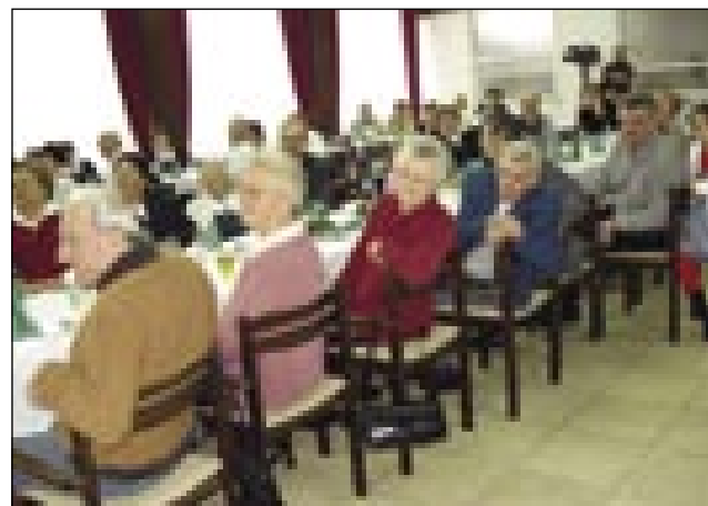
Domanji, steri so vzeli našo pozvanje z dobrim srcaum

Po tau srečanju smo na Slovenskoj zvezi (bili so z nami člani predsedstva tü) gvüšni, ka po-tejm eške več moramo djasti za tau lüstvo, naj leko majo čütenje, ka se držimo vsi vküper. S strani