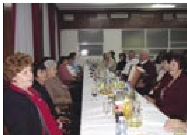
Po obedi smo malo vküper spejvali

potrebne informacije smo njim dali na znanje v pismi. Zglasilo se je nam z gosti vred 49 lidi. Smo bili fejs radi. Za program srečanja smo tak špekulirali, ka se dosta mora čüti domanja slovenska rejč, slovenske naute, mora biti fejs veseli zadvečerek pa naj majo oni dalečni dosta časa se z nami pogučavati. Za letos smo pelali števanovstji tau, Vesele pajdaše