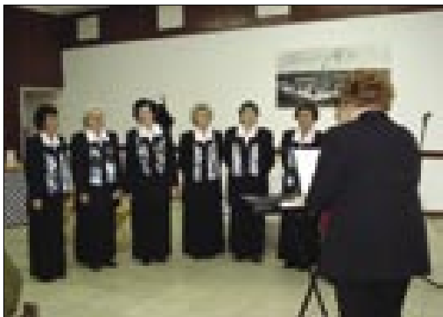
V programi so spejvale števanovske ljudske pevke

porabsko rejč. Oni so se meli za srečnoga, ka so se leko dobili vküper pa so nas prosili na Zvezi, ka buma na leto bar gnauk naj njim privauščimo tašno srečanje doma v Mosonmagyaróvári. Sploj njim je pa nej bilau vseeno, ka je