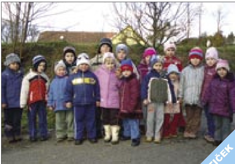
Zadnje lepe jesenske dneve so izkoristili sakalovski malčki in se večkrat podali na sprehod

P.s. V našem časopisu v članku Ž.G. smo narobe zapisali ime in priimek gospoda Agoštona. Za napako se opravičujemo.