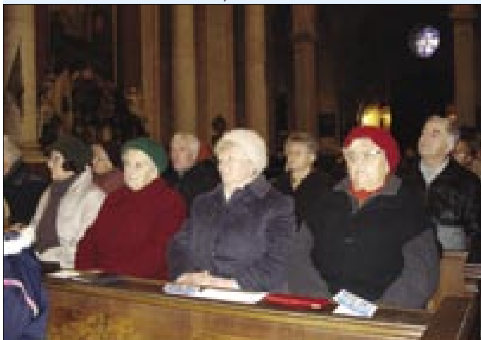
Istina, ka je lagvo vremen bilau, dapa cerkev se je zatok napunila

varaškomi župniki, gospaudi Rimfeldi, steri je posluno njino prošnje pa željo. Kak je pravo na začetki meše, v varaškoj fari živi kakšni 800 slovenski vörniov, steri bi radi boga molili v svojoj maternoj rejči (tö).