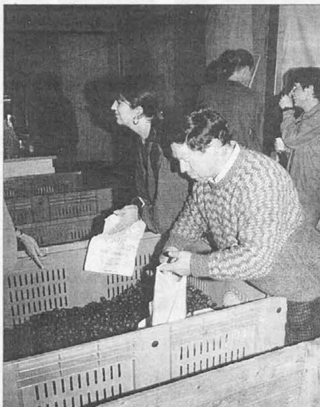
Un momento della mostra-mercato di S. Pietro in una foto d'archivio

industriale di San Pietro al Natisone, è aperto tutti i giorni dalle ore 9 alle ore 19 e nel mese di ottobre anche le domeniche che verranno anche quest'anno allietate da iniziative culturali e folkloristiche.