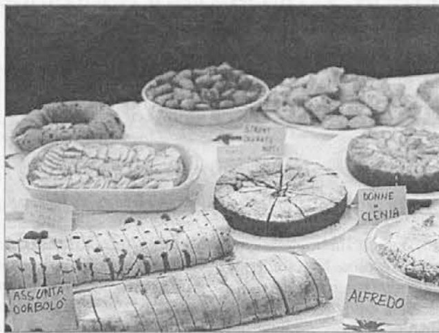
Mmmh, kake dobre reči go par Muoste!

Bodita pridni, ku te druge lieta, an parnesita puno dobrih reči: vam boj zlo hvaležni an otroc iz Minas Novas, ki bojo takuo mogli upat v buojšo zivljenje.