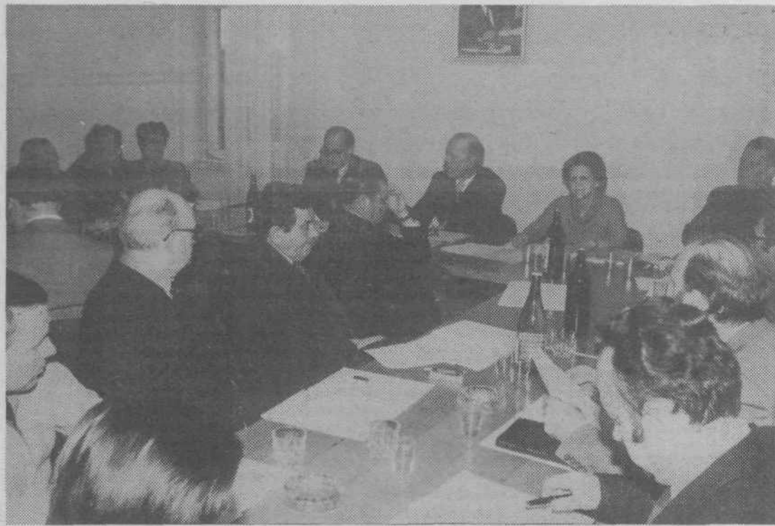
Konec januarja se je skupščina kmetijske zemljiške skupnosti sestala na 9. seji, izvolila delegate v skupščino, izvršni odbor in komisije