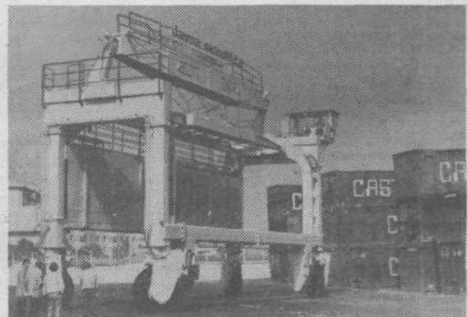
Sodobno hitro pretovarjanje zahteva tudi takele gigante

Aktivno delovanje družbenopolitičnih organizacij in samoupravnih organov ter razvoj samoupravljanja je za sluga tudi dobrega informiranja. Od obstoja dalje smo dali viden poudarek obveščeniosti naših delavcev. Že od januarja 1. 1963 izdajamo glasilo delovne organizacije in od februarja 1970 dnevne tiskane informacije, ki jih letno izide ok. 100. Oba pisana medija prideta v roke vsem delavcem, v njih pa be-