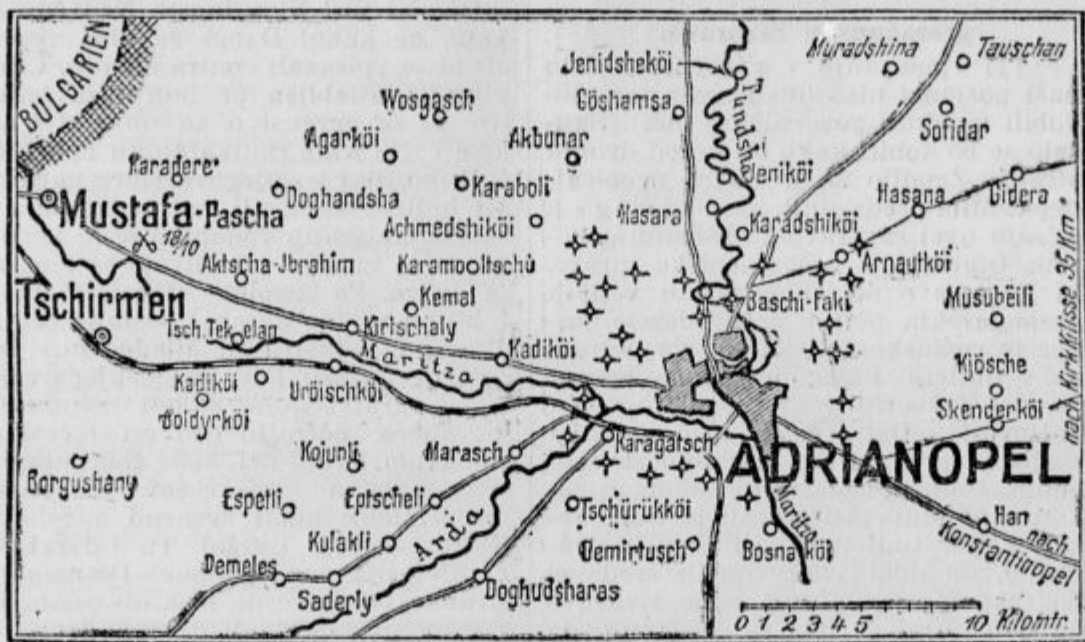
Zemljevid okolice Odrina (Adrianoel)

Iz Sofije se uradno poroča 24. t. m.: Poročilo, da so Bolgari osvojili Kirk Ki-