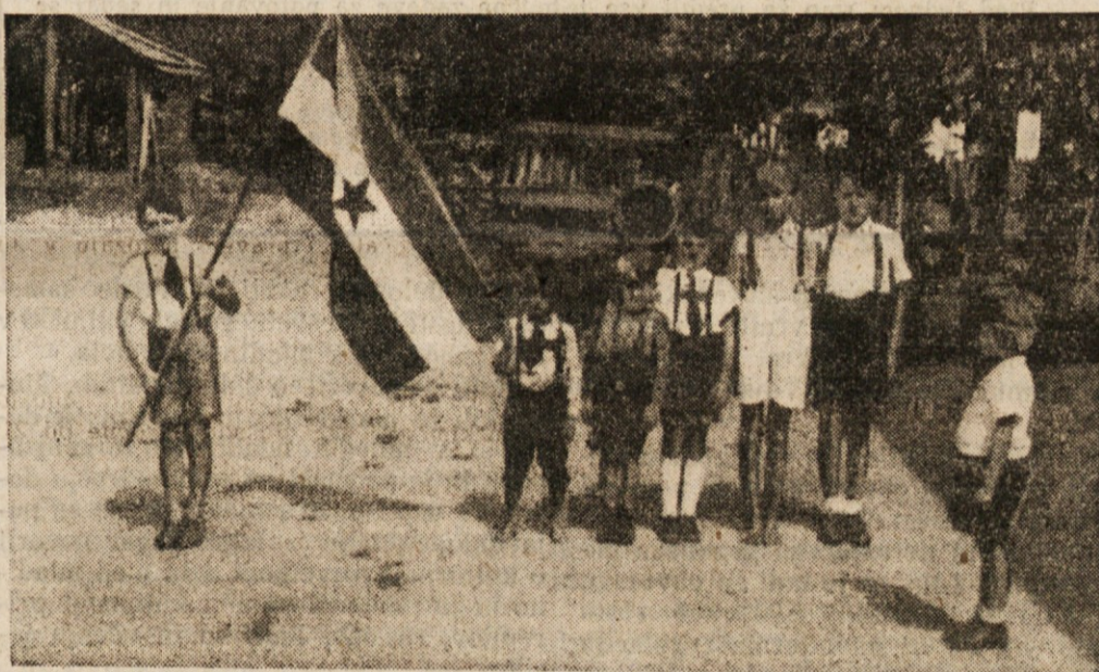
Pionirji iz Trebinja pri Št. Ilju

dilne borbe mladina osvojila svoje prvo mesto v ogromnih naporih, ob velikem trpljenju, v ogromnih žrtvah, ki jih je dala na oltar osvoboditve naših narodov ob silnem heroizmu, s katerim je vodila našo veliko borbo — s katerim se jugoslovanska mladina more često postaviti ob stran sovjetske mladine — slovenska mladina ne odstopa od svojega prvenstva tudi ne v miru, v dobi obnovitve in v dobi velikanskih naših naporov za gospodarsko preobnovo naše dežele. Po tej težki borbi, po tej slavni zgodovinski borbi in zmagi je mladina v novih okoliščinah, v resnično osvobojeni domovini, osvobojeni tujih kakor domačih zatiralcev in zajedalcev, pokazala, da tudi v gospodarski obnovi hoče biti v prvih vrstah za ustvaritev pogojev blagostanja naših narodov. Pretekla doba od