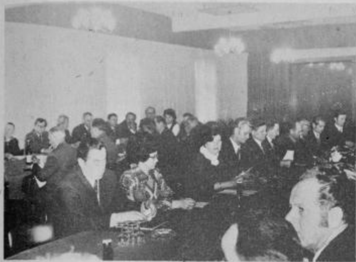
Na konferenci obč. zveze združenj borcev NOV Ptuj

katerem je 147 borcev. Posebno pozornost so lani posvetili uresničevanju koncepta SLO. Ob tem so pohvalili ustrezno vključevanje mladine, tabornikov, planincev in radioamaterjev. Skrbi jih pa dejstvo, da je na delu v tujini 450 mladih iz ptujске občine, ki še niso služili vojaškega roka. Mladih do trideset let pa je celo 800. Poudarili so tudi pomembnost šol pri vsestranskem moralnopolitičnem osveščanju in izobrazbi mladih. Tudi za svoje člane so zelo skrbeli. Tako so lani 86 borcem pomagali z denarno