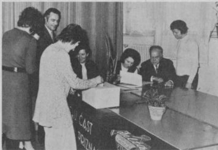
95 % je glasovalo na referendumu za združitev

nji strojni park. Zgradili bodo novo skladišče, sedanje pa preuredili v industrijski proizvodni obrat pa tudi število zaposlenih se bo povečalo za dobrih sto ljudi. Delta bo še naprej izdelovala predvsem moške srajce. Obrat v Kidričevem pa bodo preselili v Ptuj. Z modernizacijo podjetja se bo dvignil tudi povprečni osebni dohodek, predvsem pa se bo povečala storilnost in število proizvedenih artiklov.