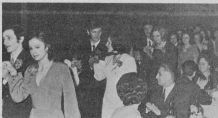
V letošnjem letu obiskuje zadnji letnik ptujske gimnazije 64 dijakov, od tega 37 deklet in 27 fantov. Letošnji tradicionalni maturantski ples je bil pretekli teden v veliki dvorani TGA Kidričeve in s te priložitve objavljamo gornji posnetek.