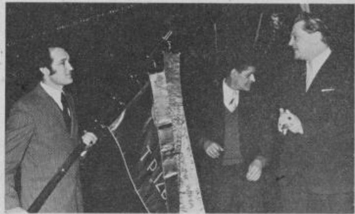
Razvitje prapora sindikata IZBIRE

TOZD MODA lahko zdaj računa s hitrim razvojem v okviru IZBIRE.