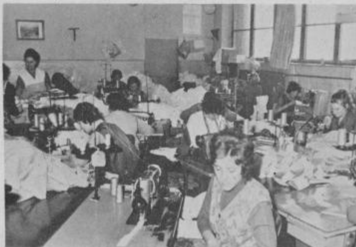
Pogled v šivalnico.