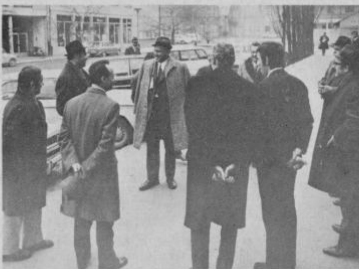
France Popit ob sprejemu pred hotelom Poetovio