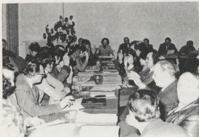
Glasovanje delegatov za proračun občine za leto 1980

Izvršni svet skupščine občine Grosuplje je v mesecu februarju letos dal v javno razpravo osnutek proračuna občine za leto 1980. Na podlagi pripomb delegacij, predlogov upravnih organov in strokovnih služb je bil pripravljen predlog proračuna, ki so ga delegati vseh zborov skupščine občine obravnavali in sprejeli na seji dne 26. marca 1980.