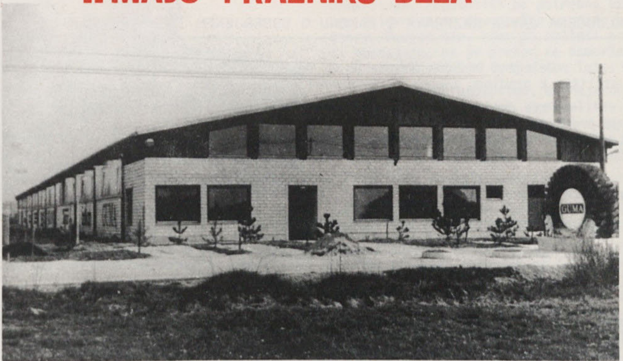
NOVOST V GROSUPLJEM - DO "GUMA"

in -DNEVU USTANOVITVE OF 1. MAJU-PRAZNIKU DELA