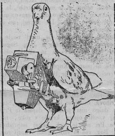
Die Brieftaube als Photograph.

Kakor znano, se je golobe že desetletja sem tako dresiralo, da nosijo pisma v velike daljave. Zlasti za vojaško službo ima to veliki pomen. Zdaj so pa še nekaj novega izumili v avstrijski in nemški armadi. Kakor kaže naša