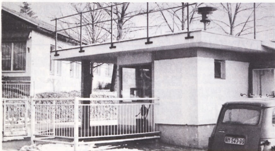
Ob pogledu na vratarnico se nehote vsiljuje vprašanje – Kaj pomeni in čemu služi ta ograja? Podobno fotografijo smo že objavili a se ni nič spremenilo. Verjetno bomo morali počakati na drugo obletnico odkar se je podrl napis NOVOLES in bomo takrat postavitve novega proslavili toliko bolj slovesno.

Izpolnitev plana proizvodnje preko celega leta po mesecih, se je odražala v dobrih rezultatih, le februar in marec sta bila nekoliko slabša, saj je bil plan