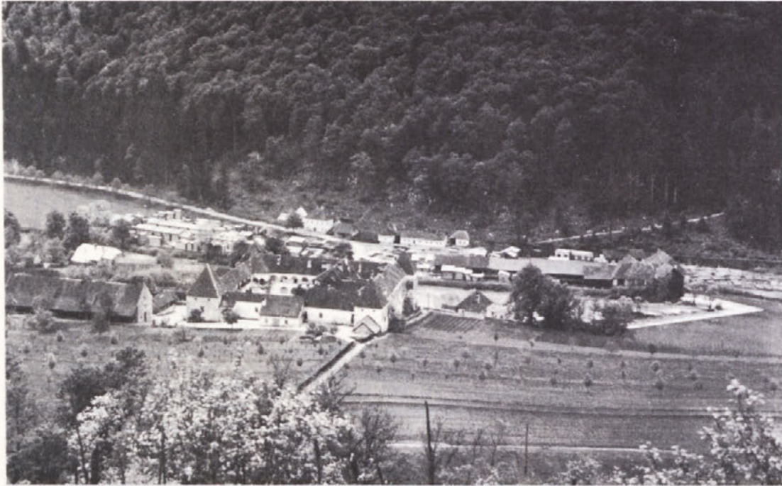
SOTESKA V LETU 1940