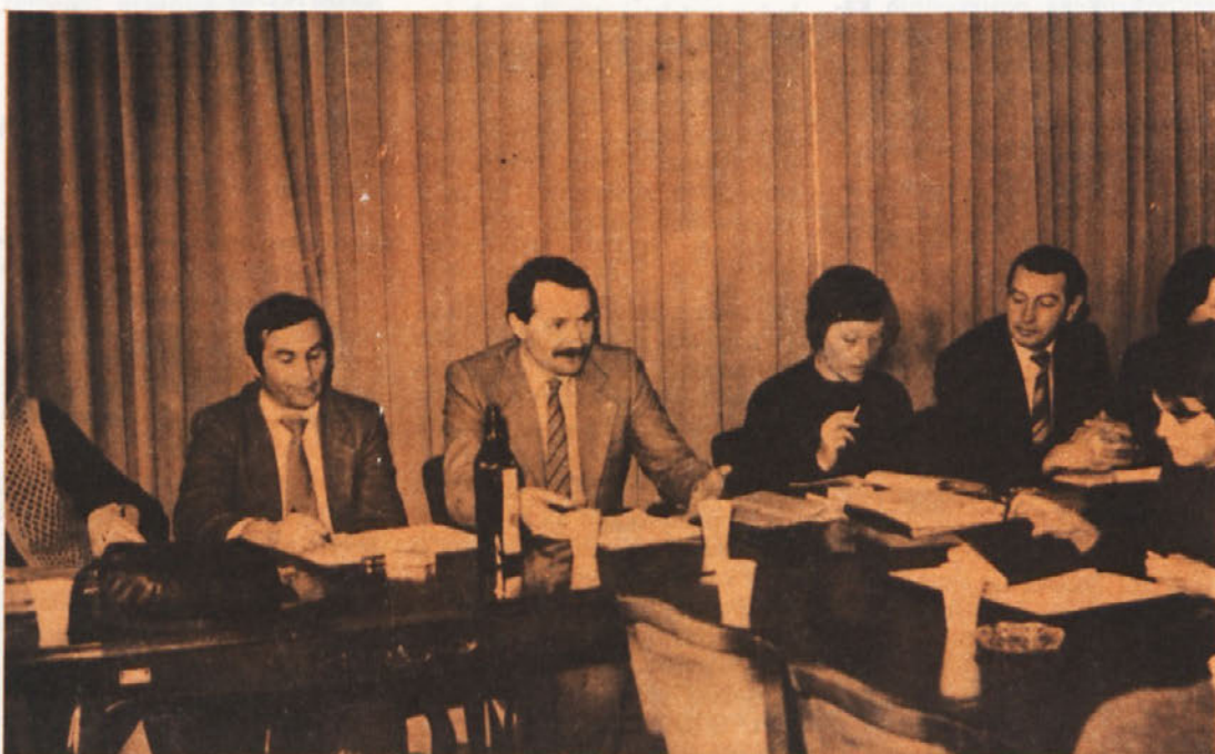
V petek 23. 2. 1981 je bila v sejni sobi DO NOVOLES v Straži 14. seja Sveta RS ZSS za zdravstveno varstvo in socialno politiko. Na seji so sprejeli poročilo o delu v letu 1980 in program dela Sveta za leto 1981. Poleg tega so obravnavali uresničevanje stališč predsedstva RS ZSS o humanizaciji dela z vidika varstva pri delu, zdravstvenega varstva in invalidnosti ter obravnavali spremembe samoupravnega sporazuma o pravicah in obveznostih iz zdravstvenega varstva.