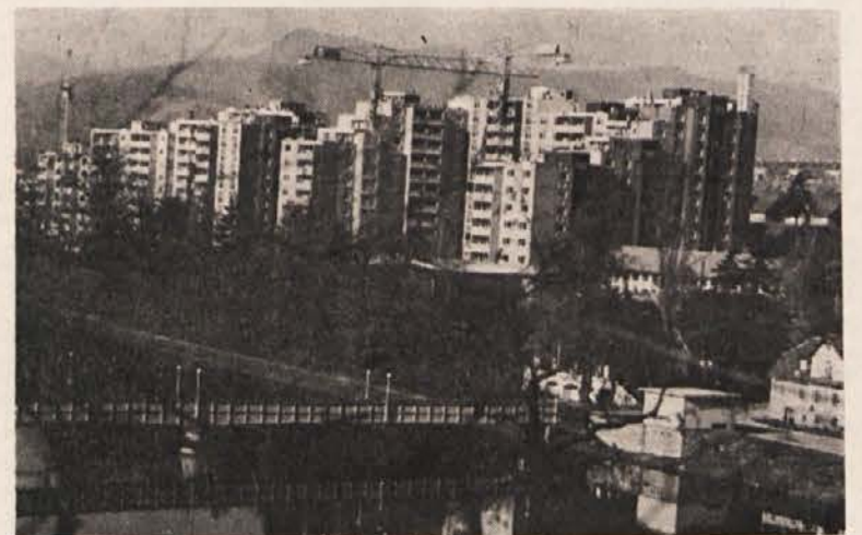
Stanovanjska soseska v Mariboru s 332 stanovanji, zgrajena v letih 1977-1978.

Pa tudi dežele v razvoju so predmet poslovnih interesov mariborskega KONSTRUKTORJA.