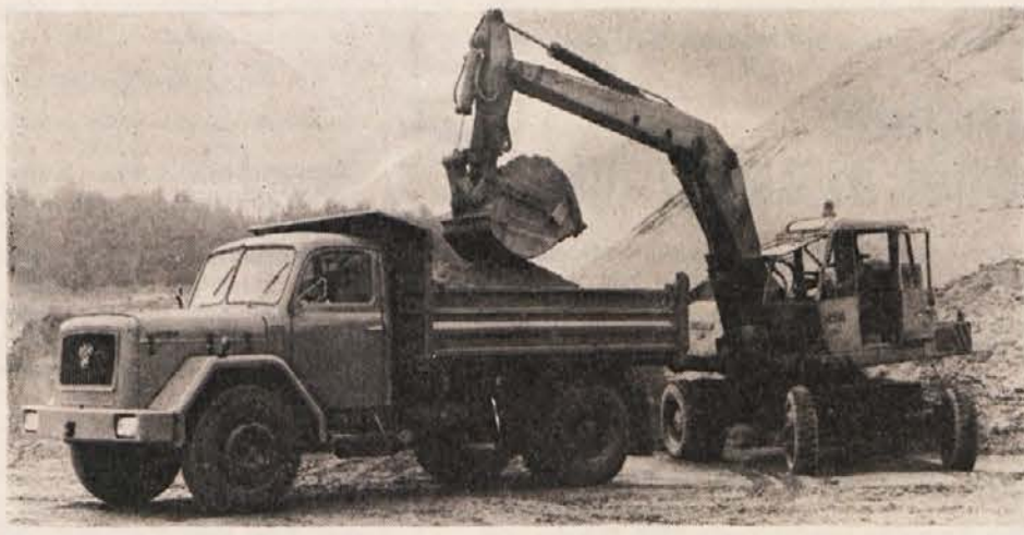
Prekucnik TAM 170 T 14 K

TAM je danes doma in v svetu najbolj znan po proizvodnji gospodarskih vozil in motorjev. Letno izdelava okrog 10.000 vozil, skupno pa je doslej izdelal preko 121.000 raznih vrst vozil. Vozila TAM so se uspešno uveljavila tudi na tujih tržiščih in vrednost izvoza vedno bolj narašča; danes izvažajo TAM vozila v vrednosti preko 20 milijonov dolarjev. Do leta 1980 pa bodo proizvodnjo povečali od 10 na 14 tisoč vozil letno.