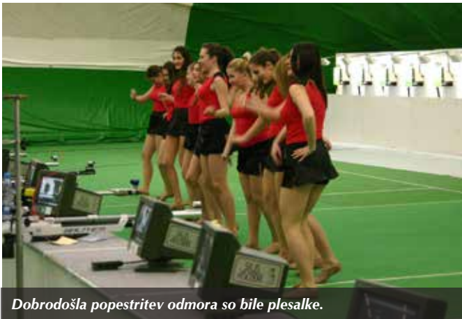
Dobrodošla popestritev odmora so bile plesalke.