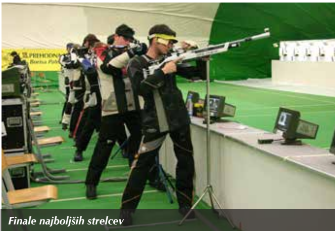
Finale najboljših strelcev