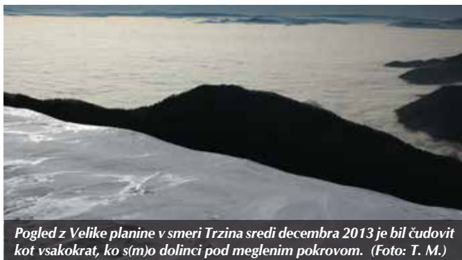
Pogled z Velike planine v smeri Trzina sredi decembra 2013 je bil čudovit kot vsakokrat, ko s(m)o dolinci pod meglenim pokrovom.

In smo padli noter, direktno v novo, 2014. leto! Vsekakor tega niste mogli opaziti po vremenu, saj nas to občasno, podobno kot naši »odločevalci in vodstveniki« (nekateri nas žal kar stalno ...), še naprej uspešno »farba«. Natančneje, daje nam vtis, da smo še vedno v jeseni, no ja, morda pa celo že na začetku pomladi; od zime nismo