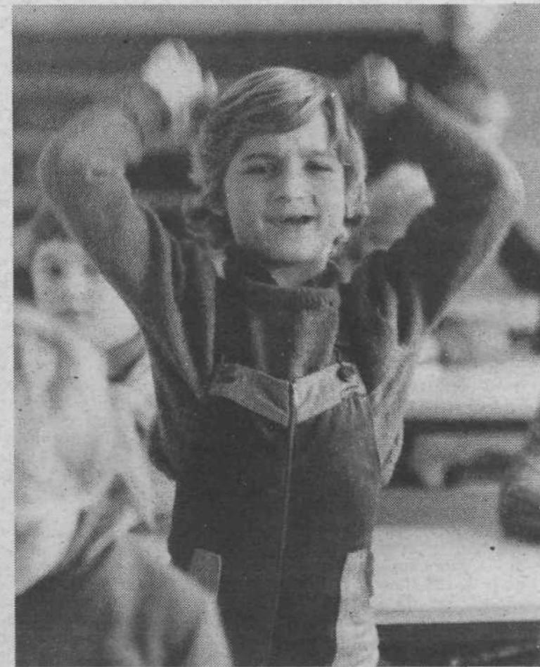
Ko bom pionirka, bo čisto drugače. Boste videli, da bo!

kar delamo in živimo ter da jim vse pre pogosto posvečamo premalo skrbi.« V.K.