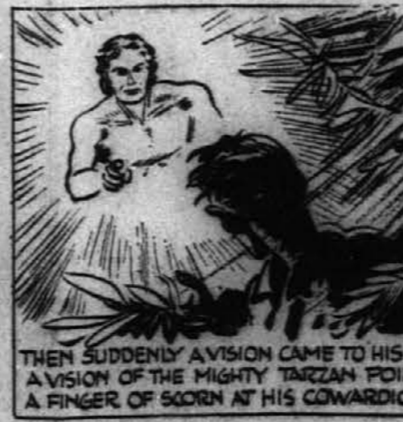
THEN SUDDENLY A VISION CAME TO HIS MIND... A VISION OF THE MIGHTY TARZAN POINTING A FINGER OF SCORN AT HIS COWARDICE