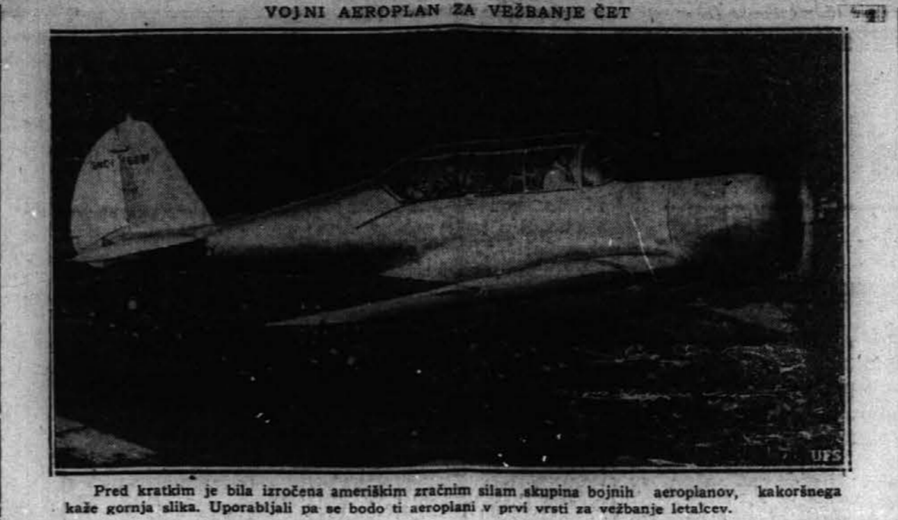
Pred kratkim je bila izročena ameriškim zračnim silam skupina bojnih aeroplanov, kakoršnega kaže gornja slika. Uporabljali pa se bodo ti aeroplani v prvi vrsti za vežbanje letalcev.