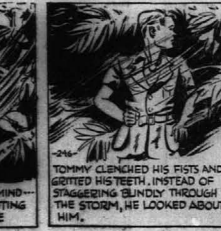
TOMMY CLENCHED HIS FISTS AND GRITTED HIS TEETH. INSTEAD OF STAGGERING BLINDLY THROUGH THE STORM, HE LOOKED ABOUT HIM.