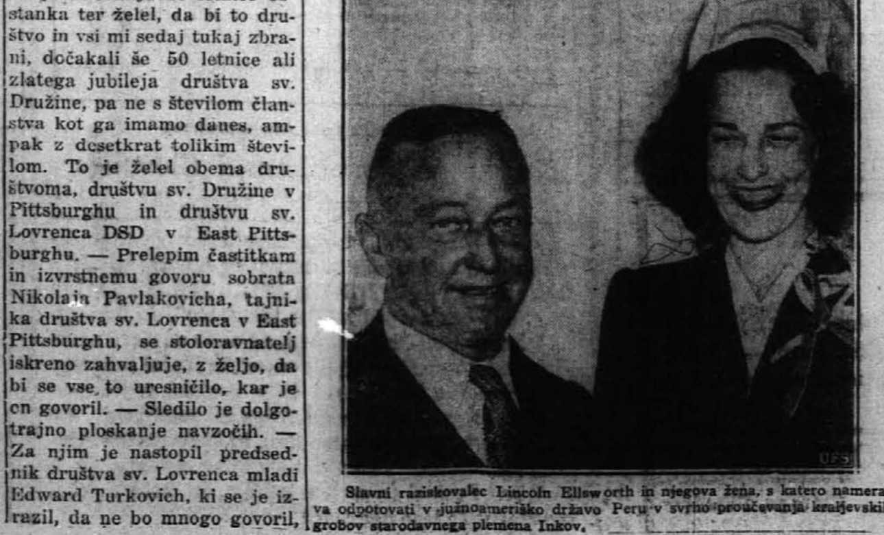
Slavni raziskovalec Lincoln Ellsworth in njegova žena, s katero namerna odpotovati v južnoameriško državo Peru v vrhu proučevanja krajevskih grobov starodavnega plemena Inkov.