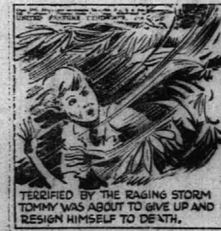
TERRIFIED BY THE RAGING STORM TOMMY WAS ABOUT TO GIVE UP AND RESIGN HIMSELF TO DEATH.