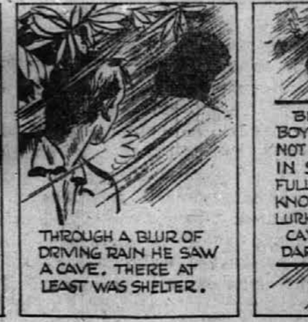
THROUGH A BLUR OF DRIVING RAIN HE SAW A CAVE. THERE AT LEAST WAS SHELTER.