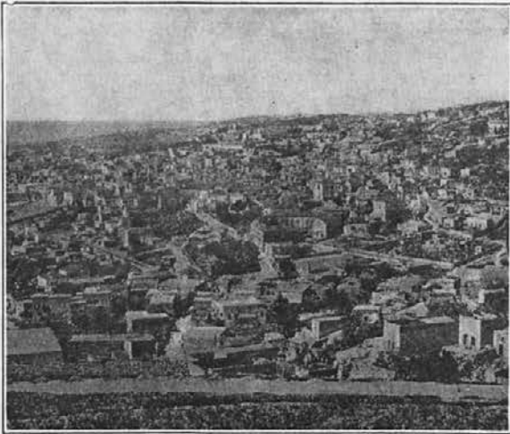
Pogled na mesto Nazaret.

francoščine. Povedal mi je, da se je teh jezikov naučil v šoli pri frančiškanih. Tega dečka sem si torej vzela za vodnika. Odvedel me je v Casa Nova, kjer sem ostal gost za dva dni.