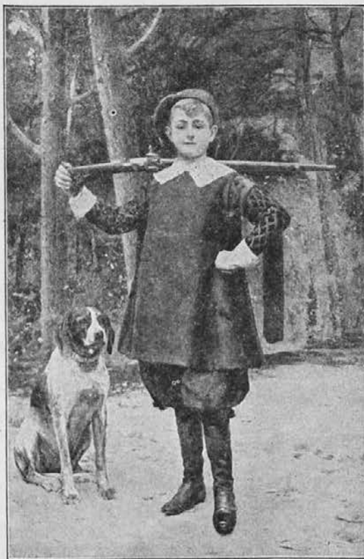
Ali je tak vaš “Tomboy”?

mora že imeti izvrstnega angela varuha — takoj je pokoncu; morebitno prasko na kolenu za silo obriše. Če je uboga glava dobila nenadoma izrastek, ga malo poteplje in smeje