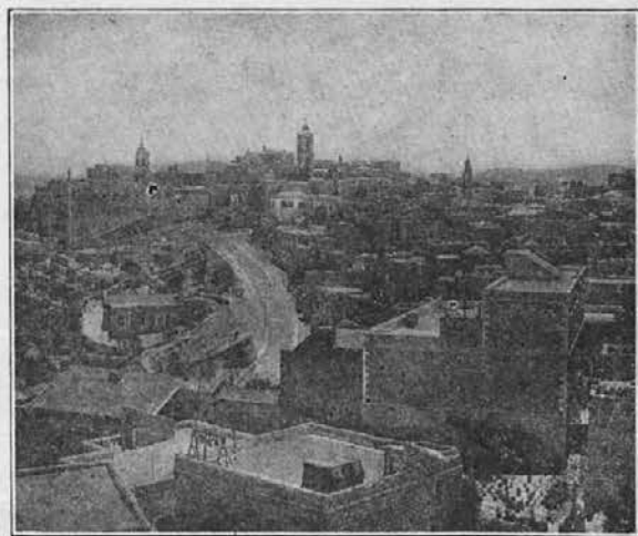
Pogled na Betlehem s cerkvijo Krist. rojstva.

iz Jeruzalema v Betlehem. Mestece leži komaj pet milj proti jugu. Zelo dobra avtomobilska cesta veže obe mesti in busi vozijo po njej vsakih 15 minut od šestih zjutraj do osmiš zvečer. Vzel sem si torej eno popoldne in se odpeljal v Betlehem pogledat baziliko Gospodovega rojstva. Ostal sem tam čez noč in maševal drugo jutro na tem svetem kraju.