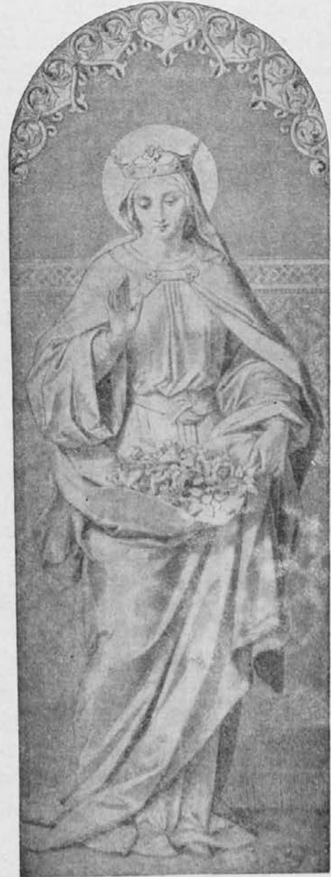
Sveta Elizabeta (19. nov.)

Nekoč je zavladala strašna lakota po vsej pokrajini. Elizabeta je velela na stežaj odpreti vse žitnice v pomoč ubogim ljudem. Ves denar v blagajni je porabila za nakup žita in prodaja je tudi vso drago-