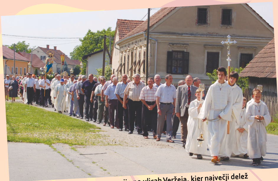
Praznik Marije Pomočnice s procesijo po ulicah Veržeja, kjer največji delež prispevajo gasilci z nošenjem Marijinega kipa.