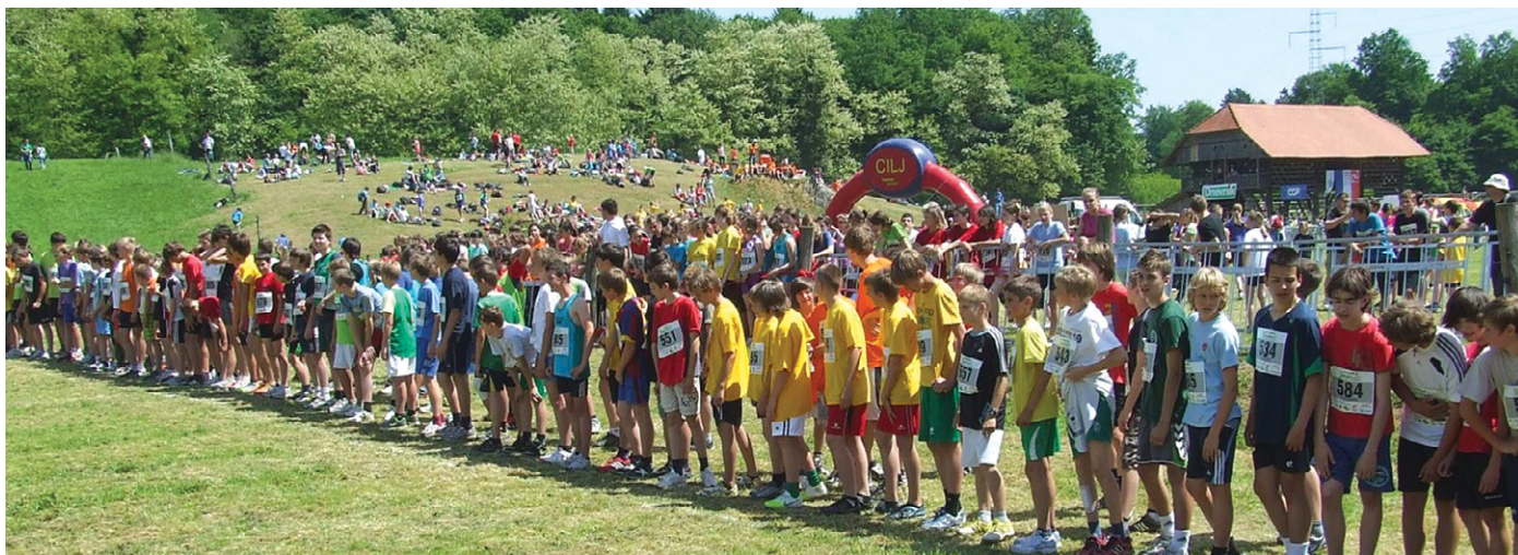
Štart sedmih razredov