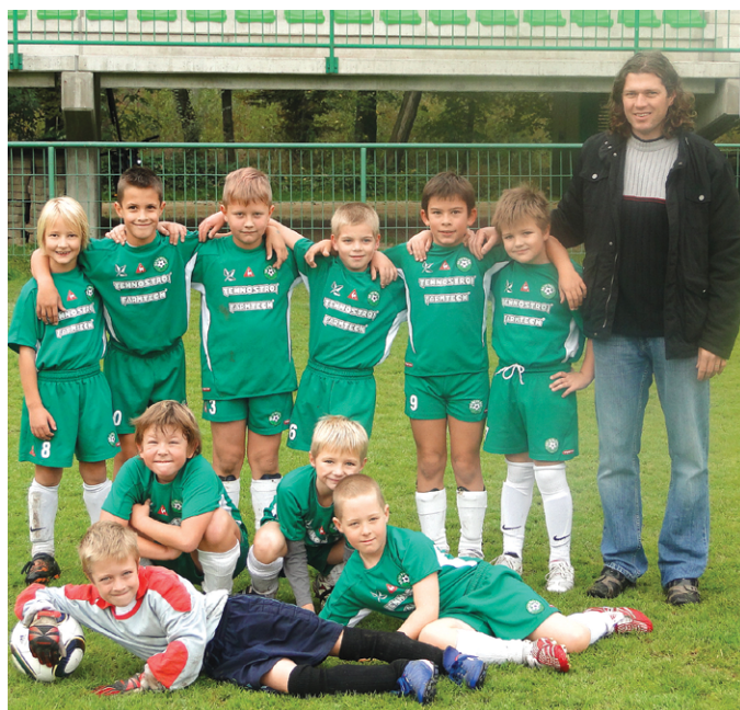
Selekcija mlajših cicibanov