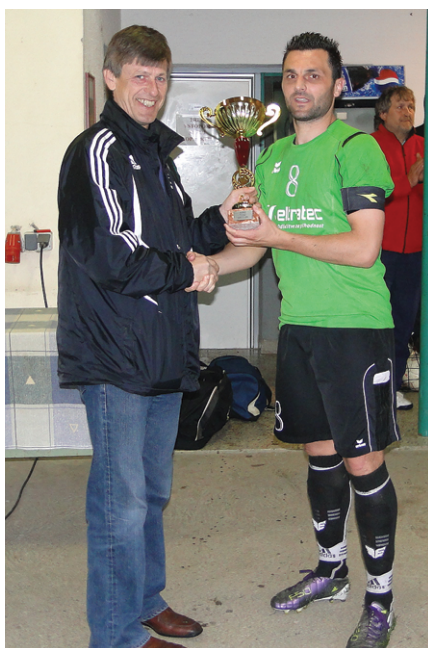
Podelitev pokala na 1. majskem turnirju