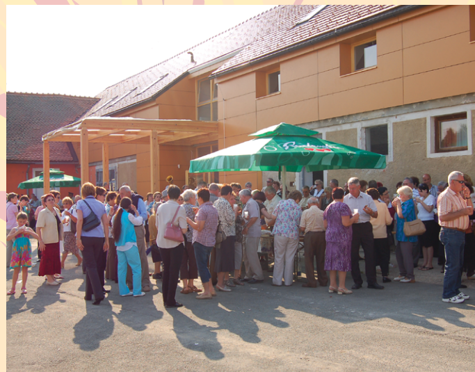
Veselo druženje se je ob dobrotah pridnih gospodinj in še boljši kapljici, v melodijah ansambla Zadnji moment, nadaljevalo še pozno v noč.