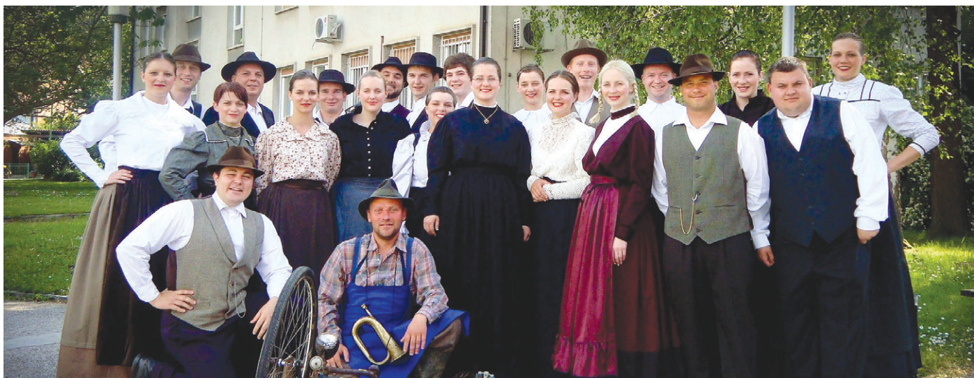
Zbrana družčina pred nastopom na reviji. Ljutomer, 14. 5. 2011