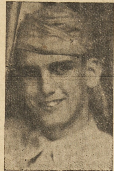
V BLAG SPOMIN SESTE OBLETNICE SMRTI PRE-LJUBLJENEGA IN NIKDAR POZABLJENEGA SINA IN BRATA

Zdajci se paznik odstrani. May koraka okoli svoje celice, dvakrat, trikrat, potem pa se-že po svoji knjigi. Eno uro ali