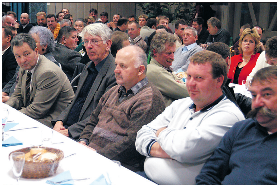
Na nekatere težave veteranov je v dvorani restavracije Gastro opozorilo 151 udeležencev.