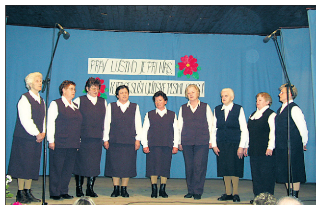
Ljudske pevke KUD Maks Furjan Zavrč so bile ene izmed desetih povabljenih skupin, ki so se predstavile na 1. srečanju pevcev ljudskih pesmi in godcev ljudskih viž.

Podgorske vaške pevke so imele z organizacijo celotne prireditve veliko dela, saj so jo same tudi vodile, kljub temu pa si bodo prizadevale, da bi postala tradicionalna.