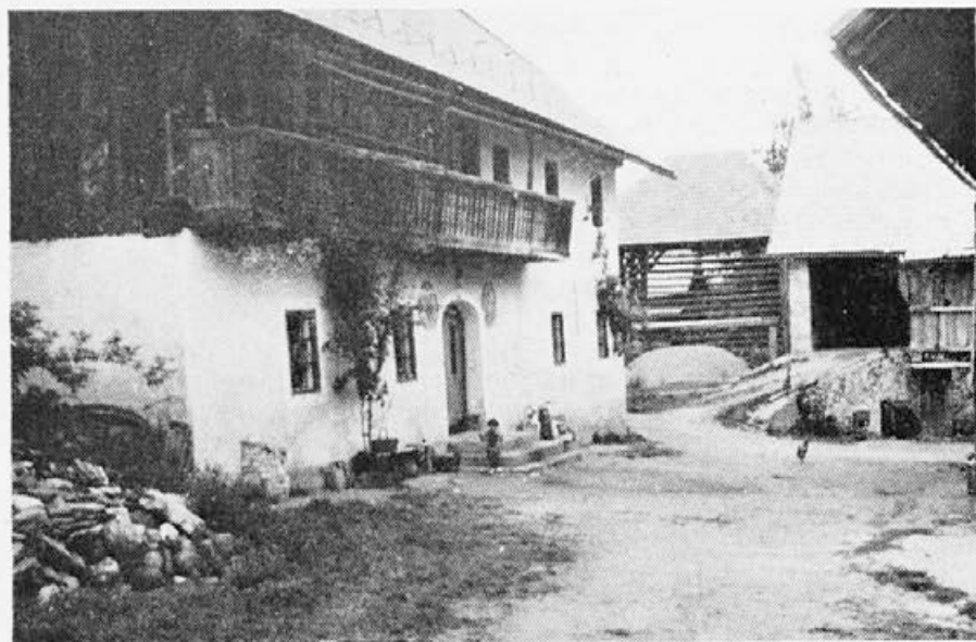
Slika 5. Slovenska alpska hiša v Ziljski dolini. Dom v gruči.

Turizem. V zadnjih desetih letih je prodril turizem tudi v k. o. Šentpavel. Iz prejšnjih gostiln so nastali trije gostinski obrati, ki imajo skupaj približno 80 postelj. V zadnjih letih pa hitro narašča število sob. Danes lahko že prenoči v večini hiš ena do štiri družine letoviščarjev.