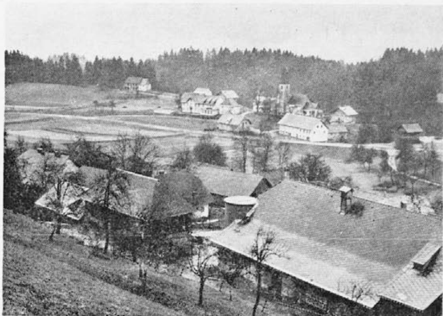
Slika 1. Šentpavel na Zilji (St. Paul im Gailtal). V ospredju hlev in kozolec (stog) moderne kmetije. V sredini gostinski obrati in novozgrajene delavske hiše