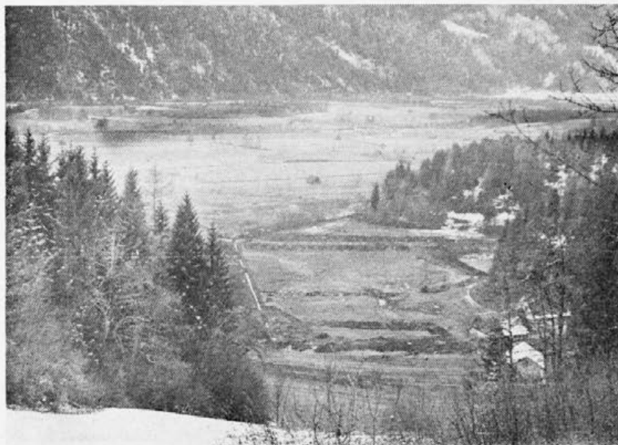
Slika 2. Kisli travniki s senki na močvirnatem dnu Ziljske doline. Področje osušujejo in bo čez nekaj let v njivah

Kot mešane kmetije bi označevali tiste kmetije, katerih posestnik je zaposlen izven posestva in ki obdelujejo nad 3 ha zemlje. Takih kmetij imamo v k. o. Šentpavel 6. Večina jih ima traktor in tudi nekaj manjših strojev. Gojijo po 5 do 10 glav živine in prodajajo mleko. Kot kmetje brez kmečkih dedičev so tudi oni solastniki pri skupnih strojih. Dohodke, ki jih imajo iz neagrarnega dela, investirajo deloma v kmetijo. Zemljo obdelujejo žena z otroki in lastnik v prostem času. Posestniki gredo čimprej v pokoj in se potem bavijo s kmetijstvom. Ta gospodinjstva se obdržijo večinoma samo eno generacijo in preidejo potem v tip delavsko-obrtniškega gospodinjstva.