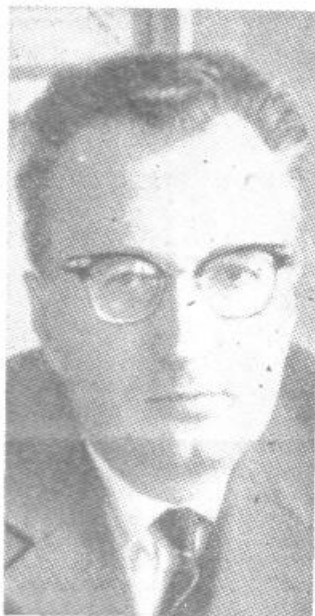
PRVI ŽUPAN - AMATER

● Večja zainteresiranost delavcev za proizvodne probleme, za povečanje skupnega dohodka itd. bo nedvomno dosežena povsod šele takrat, ko